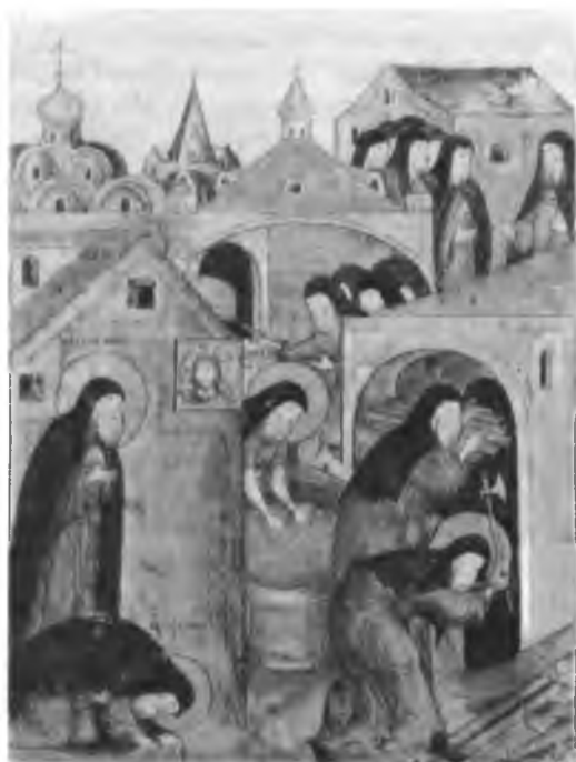
Труды прп. Савватия Соловецкого в Спасо-Преображенском Валаамском монастыре. Миниатюра. Житие прпп. Зосимы и Савватия Соловецких. Кон. XVI в. Л. 6 об.

сторонних, даже женщин. В общежительных же монастырях, владевших значительными имениями, все злоупотребления царь усвоил преимущественно настоятелям и отчасти соборным старцам, а о всех братиях свидетельствовал, что они, бедные, и алчут, и жаждут, и не имеют покоя, и терпят всякие нужды. Притом самих этих настоятелей Иоанн осуждал за злоупотребления далеко не всех, а говорил только: «Архимандриты и игумены некоторые власти докупаются...» и пр. Равно и об иноках вообще, которые искали себе в монастырях только покоя, царь выразился: «В монастырях чернецы и попы стригутся спасения ради души своя, неции же от них стригутся покоя ради телесного...» (Стоглав. Гл. 5, вопрос 8). Ошиблись бы мы, если бы и прочие свидетельства, приведенные нами, о худой стороне нашего монашества вздумали распространять не на некоторые только, а на все обители и на всех иноков. Нет, были у нас и иноки, были и монастыри в продолжение всего настоящего периода, которые вполне соответствовали своему призванию. Припомним прежде всего Пафнутия Боровского, Зосиму Соловецкого, Елеазара Псковского, Макария Колязинского — каким глубоким подвижничеством отличались они, как строго держали и вели устроенные ими обители, какое влияние имели на самих мирян и каким уважением пользовались от них! К концу XV и в начале XVI столетий