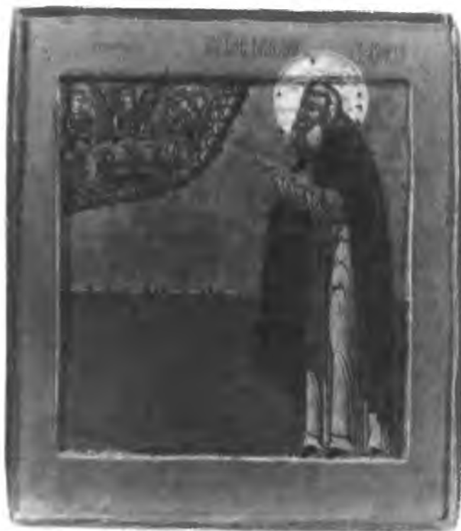
Прп. Макарий Калязинский. Икона. 2-я пол. XVII в.