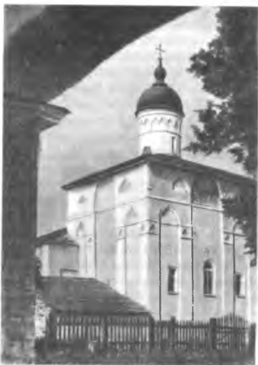
Церковь в честь Сретения Господа Иисуса Христа Антониева монастыря в Новгороде. 1537

писец перечисляет вокруг одного Новгорода шестнадцать монастырей, которые приняли тогда общежитие, и монастырей известнейших, в том числе: Антониев, Деревяницкий, Аркаж, Колмов, Волотов, Сковоротский, Нередицкий, Перынь. Впрочем, даже теперь, несмотря на все убеждения владыки Макария, нашлись два игумена «именитых монастырей» — Николаевского в Неревском конце и Христо-Рождественского на Поле, которые не захотели устроить у себя общины, хотя имели к тому полную возможность 71 . А с другой стороны, и в монастырях, принявших теперь общежитие, едва ли во всех утвердилось оно надолго: по крайней мере, о Сковоротском известно, что в 1582 г. в нем было только три кельи и жило три старца 72 . Надобно присовокупить, что не в одном Новгороде и Новгородской епархии, а и в самой Москве и во всех городах, как свидетельствовал царь Иоанн Васильевич на Стоглавом Соборе, существовали такие же малолюдные монастыри с двумя-тремя черноризцами, называвшиеся особными , или особь суццими , в противоположность общим, или общежительным 73 . И сохранилось послание к этому самому государю каких-то неизвестных иноков [98*] , которые умоляли его завести общежитие в монастырях, находившихся в окрестностях Москвы по образцу монастырей Кирилло-Белозерского, Иосифо-Волоколамского и Колязина 74 .