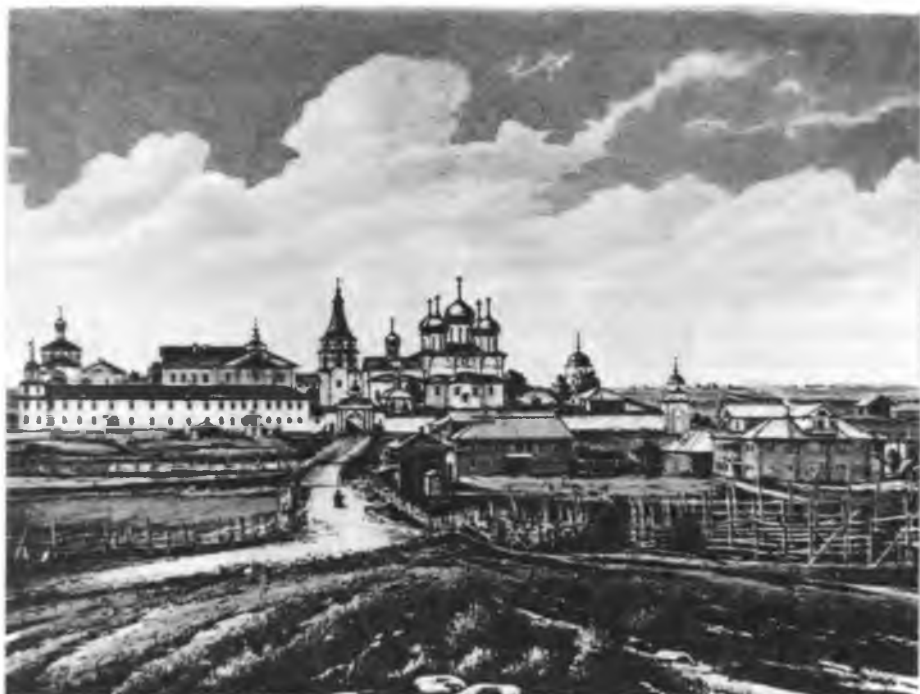
Монастырь в честь Введения во храм Пресвятой Богородицы (Корнилиев Комельский). Литография. 1881

в последние годы XV столетия основал свой общежительный монастырь на реке Еде в 50 верстах от Вологды 57 .