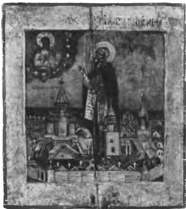
Прп. Александр Ошевенский. Икона. Кон. XVII в.