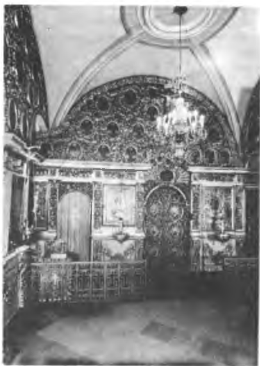
Иконостас собора в честь Успения Пресвятой Богородицы Псково-Печерского монастыря. XVII—XIX вв.

только один пустынный — преподобный Никандр, постриженник Крыпецкой обители, а уже по смерти его начал с 1585 г. устроиться монастырь трудами инока Исаии 52 .