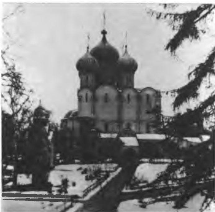
Собор в честь Смоленской иконы Пресвятой Богородицы Новодевичьего монастыря в Москве. 1-я четв. XVI в.

Он родился к концу XIV в. в сельце Кудинове близ Боровска от благочестивых родителей и по отцу происходил из татар. Дед его был некогда баскаком в Боровске и во время случившегося восстания русских против татар принял крещение с именем Мартина, чтобы спасти свою жизнь. Двадцати лет Пафнутий вступил в боровский Покровский монастырь, называвшийся Высоким, и, к счастью, с самого начала отдан был под ближайшее руководство ученику преподобного Сергия Радонежского Никите, который после игуменства своего в серпуховской Зачатьевской обители проживал теперь здесь на покое. Проведши семь лет под руководством такого старца, пока он снова не отошел в прежнюю свою обитель, Пафнутий настолько утвердился в добром направлении, что уже сам продолжал более и более возвышаться в духовной жизни. С течением времени своими добродетелями он приобрел общее уважение и любовь между братиею, так что когда настоятельское место в обители сделалось праздным, то и иноки и сам боровский князь Семен Владимирович, считавший эту обитель своею, упросили его принять сан игумена. Посвященный митрополитом Фотием (следовательно, не позже 1431 г.), Пафнутий еще ревностнее предался иноческим подвигам, подавая пример своей духовной пастве, и дни проводил в монастырских службах и работах, а ночи в молитве. Но на тринадцатом году игуменства его посетила продолжительная болезнь —