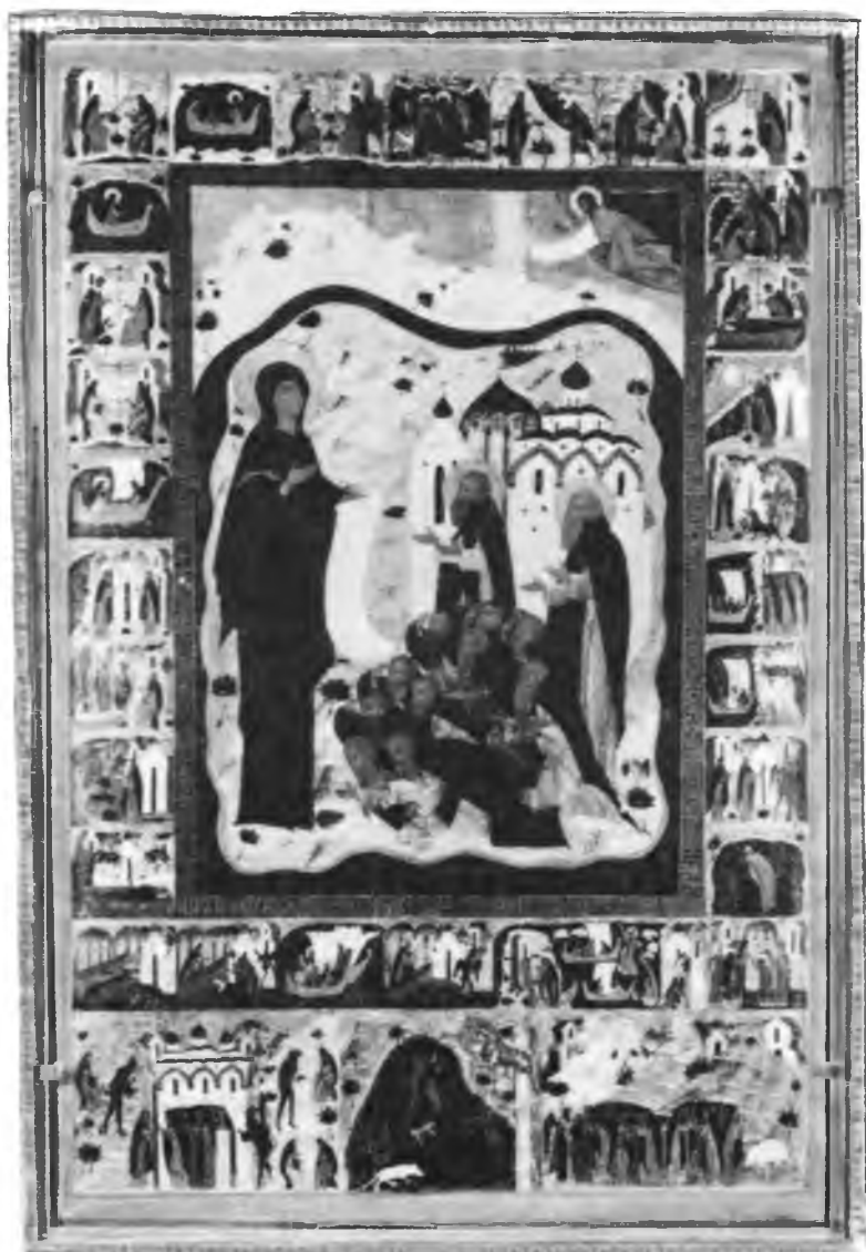
Боголюбская икона Пресвятой Богородицы с припадающими преподобными отцами Соловецкими. 1545