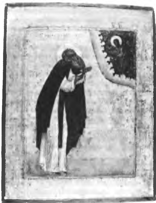
Прп. Александр Свирский. Икона. Кон. XVI в.

братства, в том числе шесть иеромонахов и два иеродиакона, а около 1585 г. в нее отпускалось руги на игумена и на 59 старцев 48 .