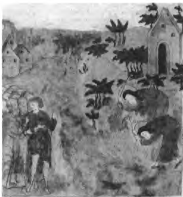
Земледельческие труды прпп. Зосимы и Германа Соловецких. Миниатюра. Житие прпп. Зосимы и Савватия Соловецких. Кон. XVI в. Л. 14 об.

некоторых владетельных монастырей за разные злоупотребления, а иноков называл бедными и терпящими всякую нужду.