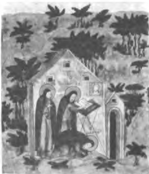
Аскетические труды прпп. Савватия и Германа Соловецких. Миниатюра. Житие прпп. Зосимы и Савватия Соловецких. Кон. XVI в. Л. 14

в отречении от всех благ мира, от всякой собственности, в нестяжательности; третии — в обуздании плоти, самоумерщвлении и целомудрии. Не надобно забывать, что, кроме этих правил, каждый инок в общежительном монастыре пользовался для своего внутреннего самоусовершенствования наставлениями своего духовного старца, наставлениями и поучениями игумена, поучениями и житиями древних святых подвижников, которые постоянно читались и во храме, и за трапезой, и самими иноками в кельях. И мы поймем, что, живя при таких условиях в общежительном монастыре, каждый инок не имел нужды заботиться ни о чем, кроме собственной души, и имел полную возможность постепенно усовершенствоваться в духовной жизни.