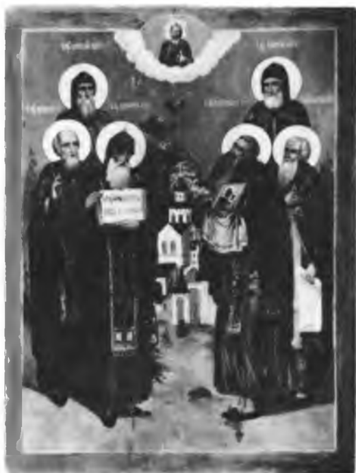
Собор преподобных отцов псковского Спасо-Елеазарова монастыря. Икона. XIX в.

находились: к юго-западу — Псковский край, к северу — Беломорский, к северо-востоку — Белоозерский, в которых также было довольно монастырей Новгородской епархии.