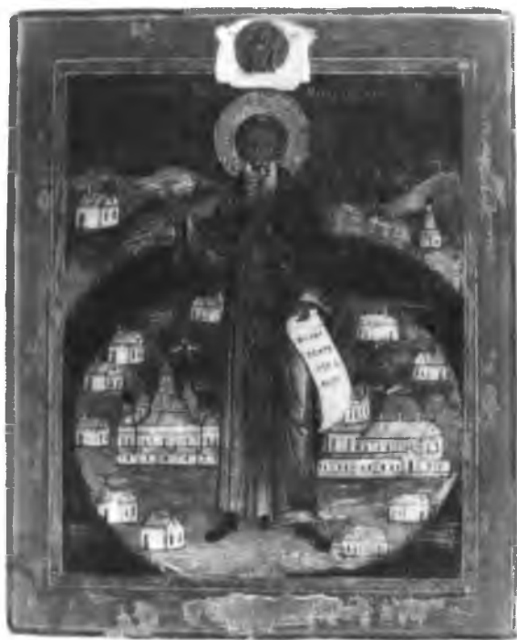
Прп. Кирилл Новозерский. Икона. XIX в.

Нам остается обозреть края Вологодский и Пермский, которые с 1492 г. составили уже одну епархию. И в прежнее время мы видели здесь до 20 обителей; теперь их появилось еще более. Кроме Печерской Троицкой пустыни, устроенной на реке Печоре Пермскими епископами в XV в., но неизвестно в каком году, и монастыря Рабанского Преображенского , основанного преподобным Филиппом в 32 верстах от Вологды на реке Рабанге в 1447 г., т.е. пред самым началом настоящего периода, во 2-й половине XV столетия возникли в этих краях следующие монастыри и пустыни: Борисоглебский , существовавший в Вологодском уезде прежде 1479 г.; Рябинина пустынь, основанная около 1485 г. в 60 верстах от Вологды на правом берегу реки Масляны; Печенгский Спасский на реке Печенге, в 20 верстах от Вологды, основанный в 1492 г. преподобными Авраамием и Коприем; Устюжский Преображенский , упоминаемый в Устюге в 1493 г.; Борисоглебский в Сольвычегодске, построенный до 1498 г.; Перцова , или Персова , Троицкая пустынь в 35 верстах от Вологды, основанная в 1499 г. преподобными Авксентием и Онуфрием; Иннокентиев Преображенский , названный по имени преподобного Иннокентия, который был из фамилии бояр Охлебининых, постригся в Кирилло-Белозерском монастыре, долго странствовал с преподобным Нилом Сорским по восточным обителям, жил потом несколько времени в его Сорском ските и наконец