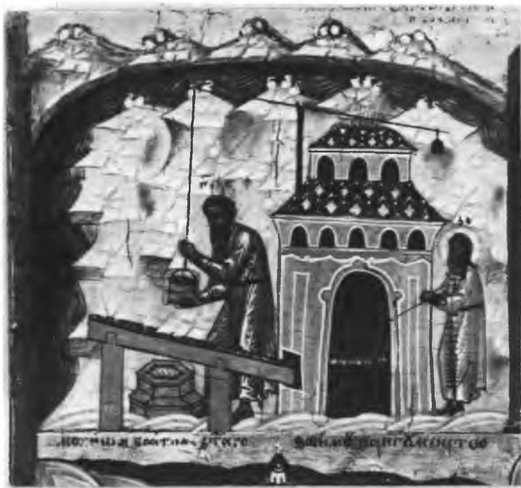
Прпп. Зосима и Герман Соловецкие варят соль. Клеймо иконы «Прпп. Зосима и Савватий Соловецкие в житии». 2-я пол. XVI в.

два постриженника Крыпецкого монастыря: преподобный Нил Столбенский, подвизавшийся 27 лет в пещере близ Осташкова († 1555), и преподобный Никандр Псковский, проведенный много лет и до пострижения и после пострижения своего в глубокой пустыне между Порховом и Псковом на реке Демьянке 102 .