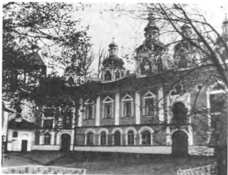
Собор в честь Успения Пресвятой Богородицы Псково-Печерского монастыря. XVI–XIX вв.

богомольцев, и он сделался славным не только во всей Литве, но и в странах соседних 51 .