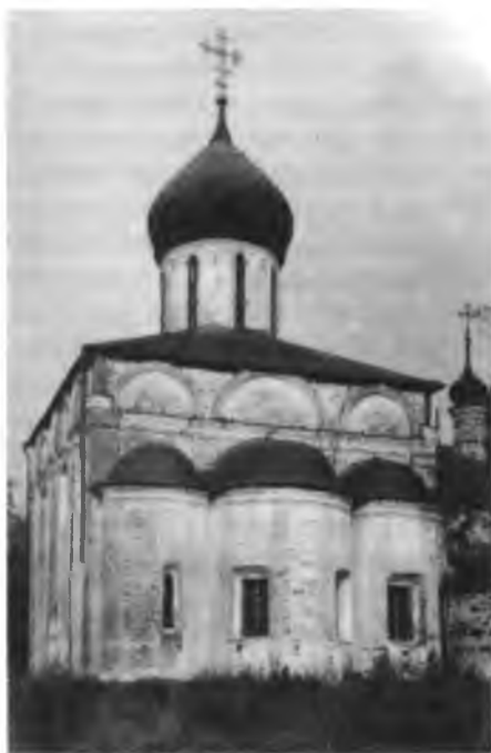
Собор во имя Пресвятой Троицы Данилова монастыря в Переяславле Залесском. 1532

руками относил в общую могилу, или усыпальницу, существовавшую в городе, и отпевал по-христиански. Не довольствуясь этим, он пожелал еще построить над общею усыпальницею храм Божий и, получив благословение от митрополита Симона, при соучастии некоторых добрых людей действительно построил во имя всех святых. А как нашлись и такие, которые возревновали построить себе тут же, вокруг храма, кельи и постричься в иноки, то преподобный согласился на это и основал (в 1508 г.) монастырь , который по имени его назван впоследствии Даниловым . Оставаясь сам в Горицкой обители, он ежедневно посещал свой «божедомский» монастырь, отправлял здесь церковную службу, наставлял иноков в подвижничестве и утешал, подкреплял их среди нужд, какие они на первых порах терпели. Братия Горицкого монастыря упросили преподобного быть их настоятелем и архимандритом, но он через девять месяцев оставил настоятельство и продолжал по-прежнему трудиться для своей новой обители. Великий князь Василий Иоаннович, посетив ее, нашел в ней скромную простоту во всем, порядок и благочиние, а в иноках благоговейность и умиление; был очень доволен и определил для нее ежегодное вспоможение. А при втором посещении повелел самому преподобному переселиться в эту обитель и ввести в ней общежитие, обещавшись оказывать ему всякое пособие. Старец исполнил волю государя, переселился (1511) в свой любимый