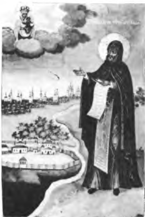
Прп. Феодосий Тотемский. Икона. Кон. XVIII в.

Сурское озеро и положил там основание новому монастырю, который впоследствии начал называться Геннадиевым [92*] . В 1531 г. великий князь убедил было преподобного Корнилия снова принять начальство над Комельскою обителию, но он вскоре оставил ее в другой раз и переселился на покой в Кирилло-Белозерский монастырь. И хотя комельские иноки упросили старца возвратиться к ним, но он уже не принял на себя игуменства, а подвизался уединенно до самой своей кончины (в 1537 г.). После кончины преподобного в основанной им обители было до 90 человек братии и некоторые из его учеников, как мы видели, сделались основателями других обителей 58 .