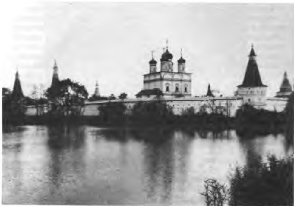
Монастырь в честь Успения Пресвятой Богородицы (Иосифо-Волоколамский)

Лаврентий, Тихон и Иеремя, епископы: Смоленский Савва Слепушкин, Полоцкий Трифон, Коломенский Вассиан Топорков, Тверской Акакий, Крутицкие: Савва Черный, Нифонт, Галактион и Симеон, Рязанский Леонид и другие 14 .