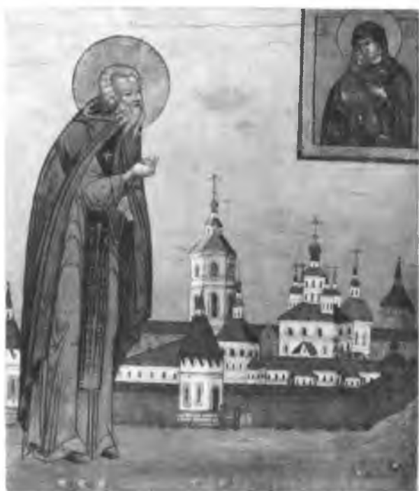
Прп. Пафнутий Боровский. Икона. 30-е гг. XIX в.

он принял схиму (и с того времени уже не священнодействовал до конца своей жизни, за исключением одного случая), отказался от начальствования над обителию и в двух верстах от нее избрал для себя уединенное место в лесу между двумя реками, где и поселился с одним из братьев. Это было в 1444 г. Скоро начали стекаться к нему сюда иноки из разных монастырей и с его согласия строили себе кельи. Когда число собравшихся значительно возросло, он позволил им соорудить деревянную церковь, которая и освящена во имя Рождества Пресвятой Богородицы по благословию митрополита Ионы (следовательно, не прежде 1448 г.). С этого времени действительно образовался или устроился боровский Пафнутиев монастырь, который еще при жизни своего основателя сделался славным во всей земле Русской. Пафнутий управлял им около тридцати лет и светил для всех своими добродетелями. Он обыкновенно в понедельник и пятницу ничего не кушал, в среду ел только хлеб, в прочие дни трапезовал вместе с братиею. Всегда трудился в тяжелых работах: сек и носил дрова, копал землю для ограды, носил воду для поливки растений, и никто прежде него не приходил ни на работу, ни на соборное правило. В зимнее же время более предавался молитве и чтению и плел сети для ловли рыбы. Женщин не только не позволял впускать в обитель, но не хотел видеть и издалека и запрещал даже говорить об них. Во всем любил скудость и нищету и о внешности