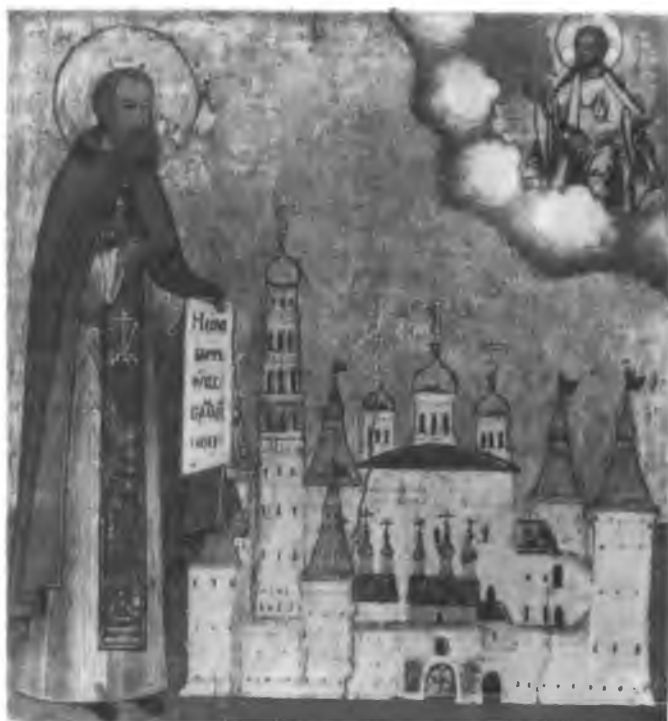
Прп. Иосиф Волоцкий. Икона. Кон. XVII—нач. XVIII в.

свои грехи протекшего дня. Никто не мог выйти за ворота обители без благословения настоятеля. А женщинам и детям вовсе запрещен был вход в обитель. Были иноки, которые, не ограничиваясь точным исполнением общих монастырских правил, решались с благословения настоятеля на некоторые особенные подвиги: один носил на своем теле острую власяницу, другой — тяжелые вериги, третий клал ежедневно по тысяче, даже по две и по три тысячи поклонов; некоторые проводили почти всю ночь в молитве и предавались сну на самое короткое время, и то сидя или стоя. Старец Герасим Черный, постоянно отличавшийся строгим постничеством, жил, наконец, как отшельник вне обители. Другой старец — Кассиан, по прозванию Босой (потому что никогда не носил обуви, даже зимой), пользовался за свои высокие подвиги таким уважением, что сам великий князь Василий Иоаннович избрал его в восприемника своему сыну Иоанну. Впрочем, оба эти старца пришли с Иосифом еще из Пафнутиевой обители. Из постриженников самого Иосифа замечательны были: Иона Голова, бывший в мире воспитателем сыновей волоколамского князя Бориса, Дионисий — из рода князей звенигородских и Арсений Голенин — из рода князей ростовских. Первый непрестанно пребывал в трудах и молитве и служил образцом смирения и сокрушения о своих грехах. Второй, кроме того что исправлял послушание в пекарне за двоих, каждый день прочитывал по 77 псалмов