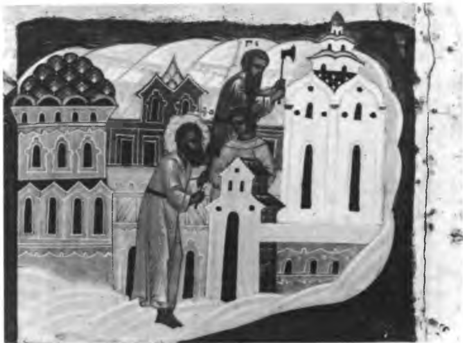
Прпп. Зосима и Герман Соловецкие пристроили к храму трапезную. Клеймо иконы «Прпп. Зосима и Савватий Соловецкие в житии». 2-я пол. XVI в.

явились новые светила в русском монашеском мире: Иосиф Волоколамский, Нил Сорский, Иннокентий Вологодский, Александр Свирский, Корнилий Комельский, которые так же, если даже не более, благотельно действовали и на своих учеников, и на все русское монашество, и на всю отечественную Церковь. Вслед за ними и отчасти вместе с ними в течение всей 1-й половины XVI в. подвизались и светили для всех своим высоким благочестием другие основатели и устроители монастырей — Даниил Переяславский, Кирилл Новоезерский, Герасим Болдинский, Арсений Комельский, Антоний Сийский. Даже во 2-й половине XVI в., после того как на Стоглавом Соборе наше монашество подверглось таким приговорам, в среде его отнюдь не прекращался ряд строгих подвижников и настоятелей монастырей, каковы были: Филипп Соловецкий, впоследствии митрополит, Трифон Кольский, просветитель лопарей, Феодосий Тотемский, Арсений Новгородский. Словом, мы могли бы поименовать до пятидесяти черноризцев, и преимущественно настоятелей, которых воспитали наши тогдашние обители и которые за свое благочестие или причислены Церковию к лику святых, или доселе чтутся местно. Справедливость требует присовокупить, что в числе этих достойных черноризцев находились не одни жившие в монастырях, но и пустынноики, между которыми особенно замечательны