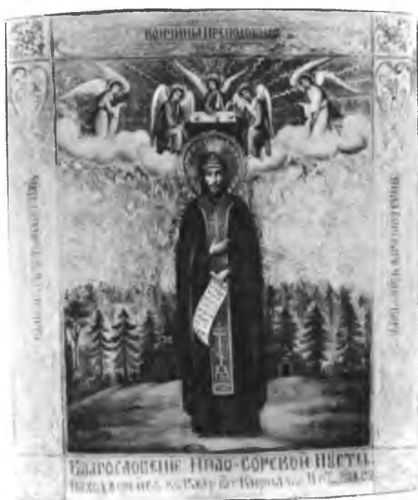
Прп. Нил Сорский. Икона. 1908

постриженник самого Корнилия, проведши 15 лет в его обители и несколько времени в странствованиях по пустыням, избрал себе место для подвигов в 45 верстах от Череповца на реке Андоге, в Красном бору, между Большим и Малым Ирапом и положил начало пустыни, которая по смерти его (1538) начала называться Красноборскою , Филиппо-Ирапскою . Третий, Иларион, после кончины своего наставника Корнилия (1537) перешел в Белозерскую страну к Илу-озеру в 30 верстах от Белозерска и, купив у одного поселянина остров, находившийся на этом озере и называвшийся Озадским, построил на нем кельи и храм в честь Рождества Богоматери и тем положил начало пустыни, названной по смерти его (1544) Иродионовою , Илозерскою , Озадскою . Три остальные обители XVI в. в Белозерской стране были: Воронина Успенская пустынь в 13 верстах от Череповца, основанная в 1524 г. по благословению митрополита Даниила монахом Марком Вороною на месте явления чудотворной иконы Божией Матери и состоявшая постоянно в ведении Московских митрополитов; монастырь Горицкий Воскресенский девич на левом берегу Шексны, в шести верстах от города Кириллова, построенный в 1544 г. иждивением удельного князя Андрея Ивановича старицкого и его супруги Евфросинии Владимировны, в иночестве Евдокии; наконец, Мирзин Покровский , упоминаемый в одной духовной грамоте 1570 г. 56