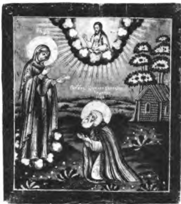
Явление Пресвятой Богородицы прп. Корнилию Комельскому. Икона. Кон. XVIII—нач. XIX в.

не только во 2-й, но, вероятно, даже в 1-й половине XV в.; Аграфинский Покровский девич, устроенный рязанскою княгиней Агриппиною в 1507 г. и называющийся пустынью; Богословский , основанный прежде 1533 г., и Воскресенский Терехов , получивший еще в 1520 г. жалованную грамоту от великого князя Василия Иоанновича 24 .