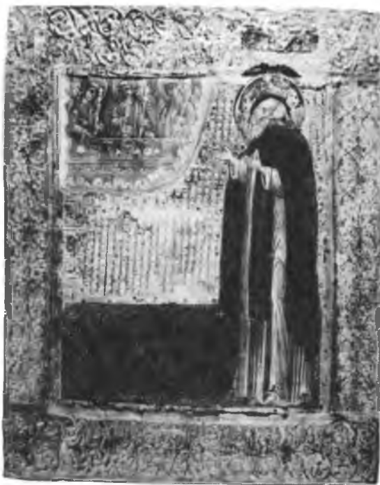
Прп. Антоний Сийский. Икона. 1-я треть XVII в.

в духовной, подвижнической жизни написал подробный «Устав скитского иноческого жития» по образцам восточных скитских уставов [91*] . Таким-то образом основался Нилов скит , или пустынь преподобного Нила Сорского, прославившийся не богатством или многолюдством братии, а строгостью устава и высотой отшельнических подвигов своего основателя. Братии здесь было немного: вскоре по смерти преподобного Нила (1508) мы видим в его ските только одного иеромонаха, одного иеродиакона и 12 старцев. Кроме Нилова скита в Белозерской стране к концу XV в. упоминается еще новый монастырь — Никитский , находившийся на правом берегу реки Шексны, в десяти верстах от города Кириллова 55 .