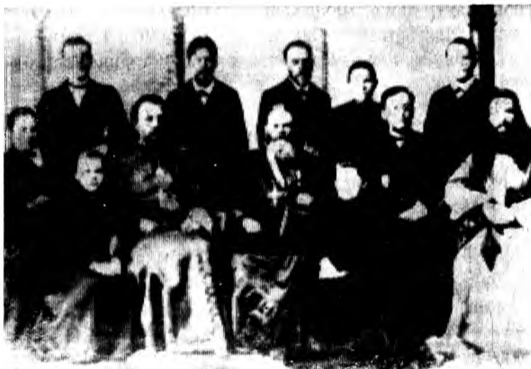
Семья Сибирцевых. Фото 1895 года.

Благодаря деятельности комитета, при поддержке епархиальной власти, в Архангельске стало возможным написание и издание 3-томного труда «Краткое историческое описание приходов и церквей Архангельской епархии». Его готовили священники всей епархии—обращались к архивным документам, приходским летописям, воспоминаниям очевидцев. Это был первый коллективный церковно-краеведческий труд подобного размаха.