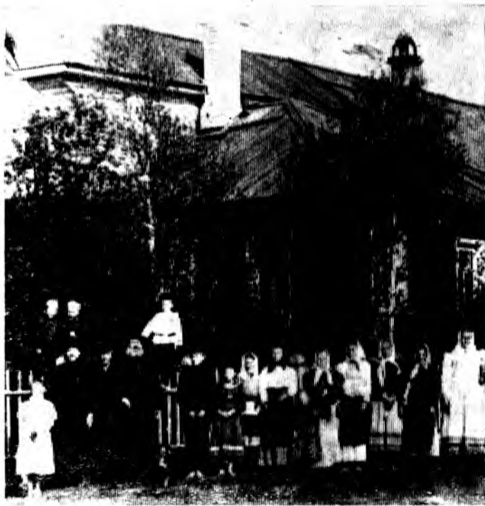
Церковно-приходская школа (Кадниковский уезд). Фото 1875 года. Публикуется впервые.

ковыми становились сами священники или выпускники семинарий и училищ, не имевшие сана. Затем стали приезжать выпускницы епархиальных училищ.