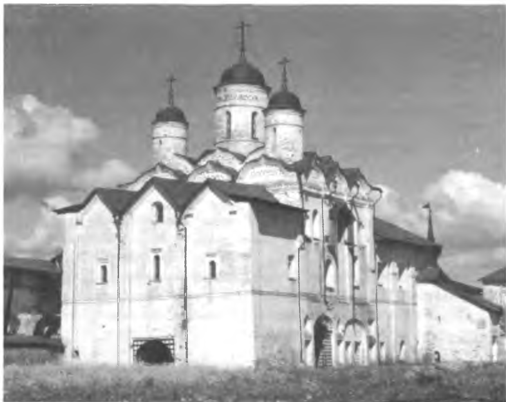
Церковь Преображения по завершении восстановительных работ

вышением стены) дало дату — 1629 год. Таким образом, мы имеем дело с относительно очень ранним наслоением, которое характеризует важный этап строительной истории монастыря.