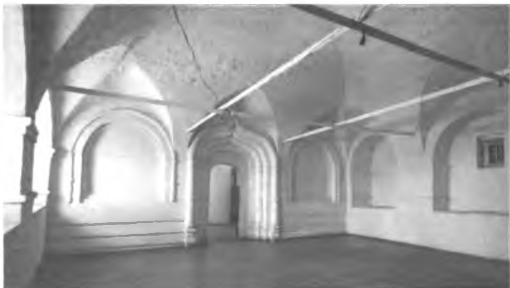
Церковь Преображения. Интерьер западной паперти