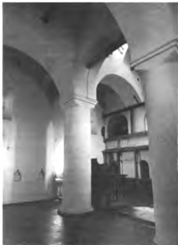
Церковь Преображения. Интерьер храма