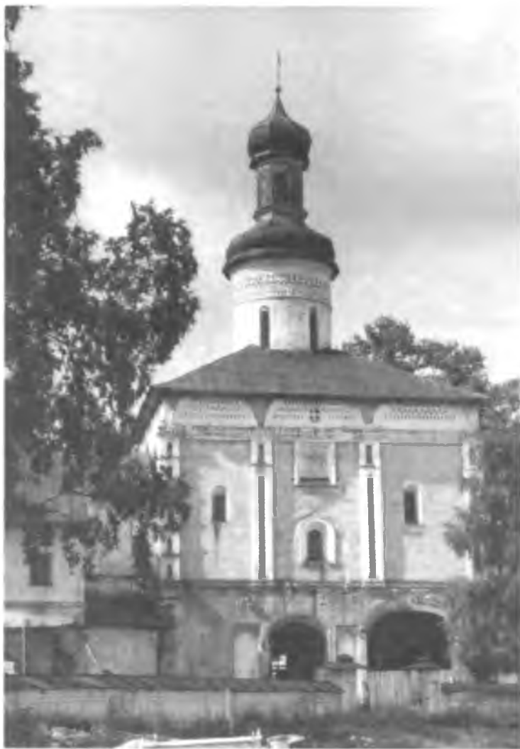
Церковь Иоанна Лествичника Кирилло-Белозерского монастыря. Северный фасад

Шурф, заложенный у северного фасада памятника, дал возможность установить здесь уровень дневной поверхности XVI в., который оказался на 1 м ниже современного. Теперь, благодаря происшедшему изменению уровня воды в озере, древняя отметка участка частично находится ниже уровня озера и практически не может быть открыта.