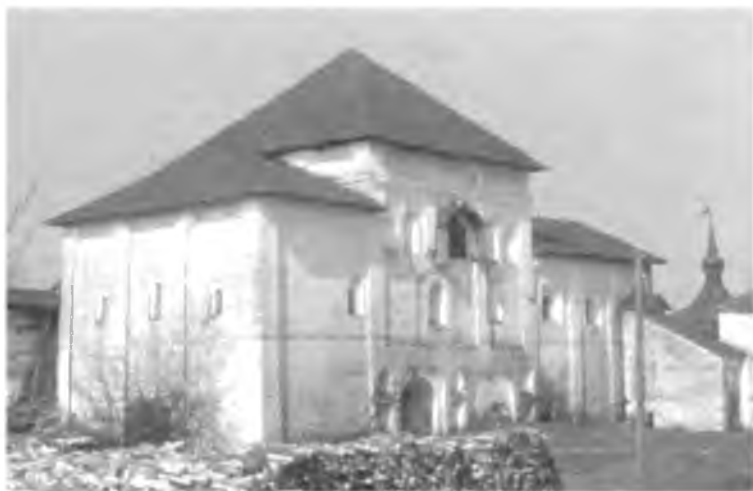
Церковь Преображения до реставрации

Здание сложено из кирпича размером 7,5-8 \times 14,5-15 \times 30-31, 32 см. Поставленное на подклете, оно состоит из церкви, алтаря и большой квадратной в плане паперты, перекрытой сомкнутым сводом с распалубками. Церковь двустолпная, с круглыми столбами, перекрыта тремя коробовыми сводами, опирающимися на подпружные арки. Алтарь представляет внутри общее прямоугольное в плане помещение, разделенное на три части переброшенными с восточной стены на западную арками, на которые опираются коробовые своды. Под церковью были устроены два прохода из монастыря к озеру, больший из которых заложен. Под папертью — большая палата,