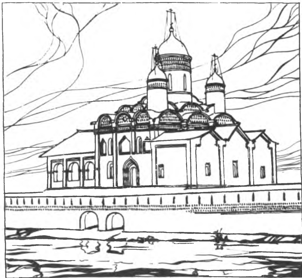
Церковь Преображения. Вид с Северского озера. Реконструкция С. С. Подъяпольского.

При обследовании заложенных арочных проемов западной паперти удалось установить, что во всех проемах сохранился старый парапет. Следовательно, вход на паперть первоначально мог быть только там, где он находится и сейчас, т. е. в западной части северного фасада. Высказанное Даниловым предположение о существовании входа на паперть с запада не подтвердилось. Крытая лестница как по материалу (кирпич), так и по характеру раствора не отличается от основных частей здания. Лестница приложена к стене паперти без перевязи и частично закрывает окно подклета. По-видимому, она сооружена вскоре после построения церкви.