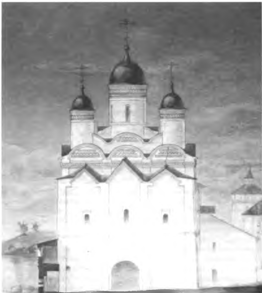
Церковь Преображения. Восточный фасад. Первый вариант эскизного проекта реставрации. Автор С. С. Подъяпольский