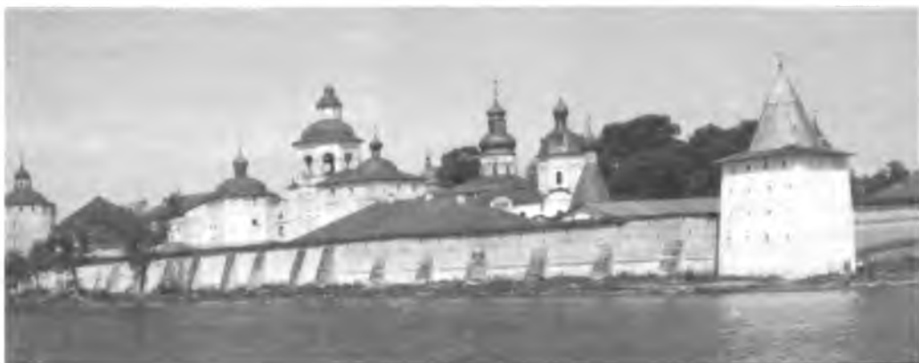
Кирилло-Белозерский монастырь со стороны Сиверского озера. Фото 1956 г.

Здание сложено из кирпича размером 7,5-8 \times 14,5-15 \times 30-31, 32 см. Поставленное на подклете, оно состоит из церкви, алтаря и большой квадратной в плане паперты, перекрытой сомкнутым сводом с распалубками. Церковь двустолпная, с круглыми столбами, перекрыта тремя коробовыми сводами, опирающимися на подпружные арки. Алтарь представляет внутри общее прямоугольное в плане помещение, разделенное на три части переброшенными с восточной стены на западную арками, на которые опираются коробовые своды. Под церковью были устроены два прохода из монастыря к озеру, больший из которых заложен. Под папертью — большая палата,