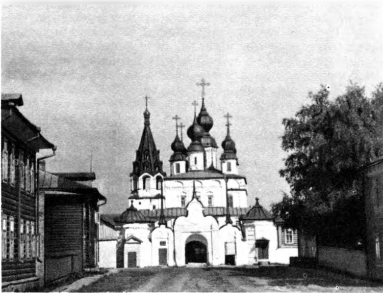
Общий вид Михаило-Архангельского монастыря со стороны главного входа

ковь. Но поскольку церковь эта продолжала сохранять свое значение главных Святых ворот монастыря, постольку новые стены примкнули к ней под углом и образовали на месте засыпанного к тому времени ручья и бывшего моста широкий парадный проход. 1