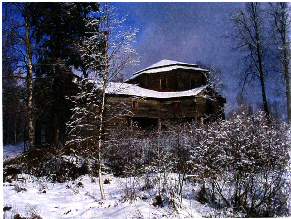
Состояние памятника накануне реставрации. Январь 2003

по-видимому, из-за ограниченного финансирования выпущен только один исследовательский том по архитектурно-археологическим обмерам памятника 4 . В целом эта работа растянулась на девять лет и завершилась составлением сметы в 1991 5 . Столь длительный срок работы над проектом объясняется экономическим хаосом, царившим в стране. В отдельные годы реставрацию вообще не финансировали, поэтому в 1987, 1989, 1990 годах работы над проектом не велись.