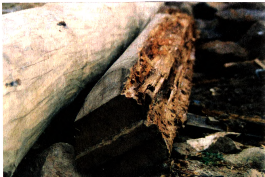
Состояние строительных элементов памятника. 2003