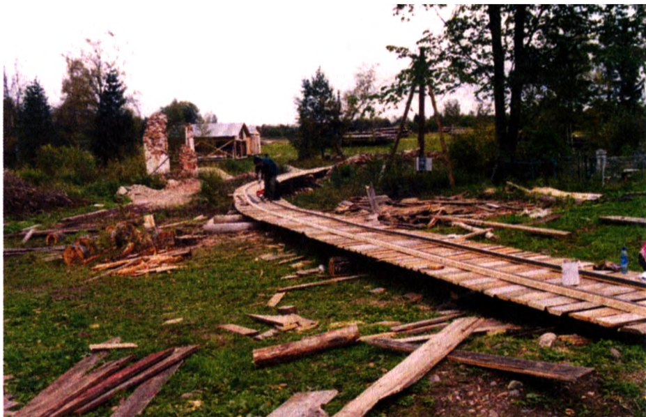
Подготовка строительной площадки. 2003