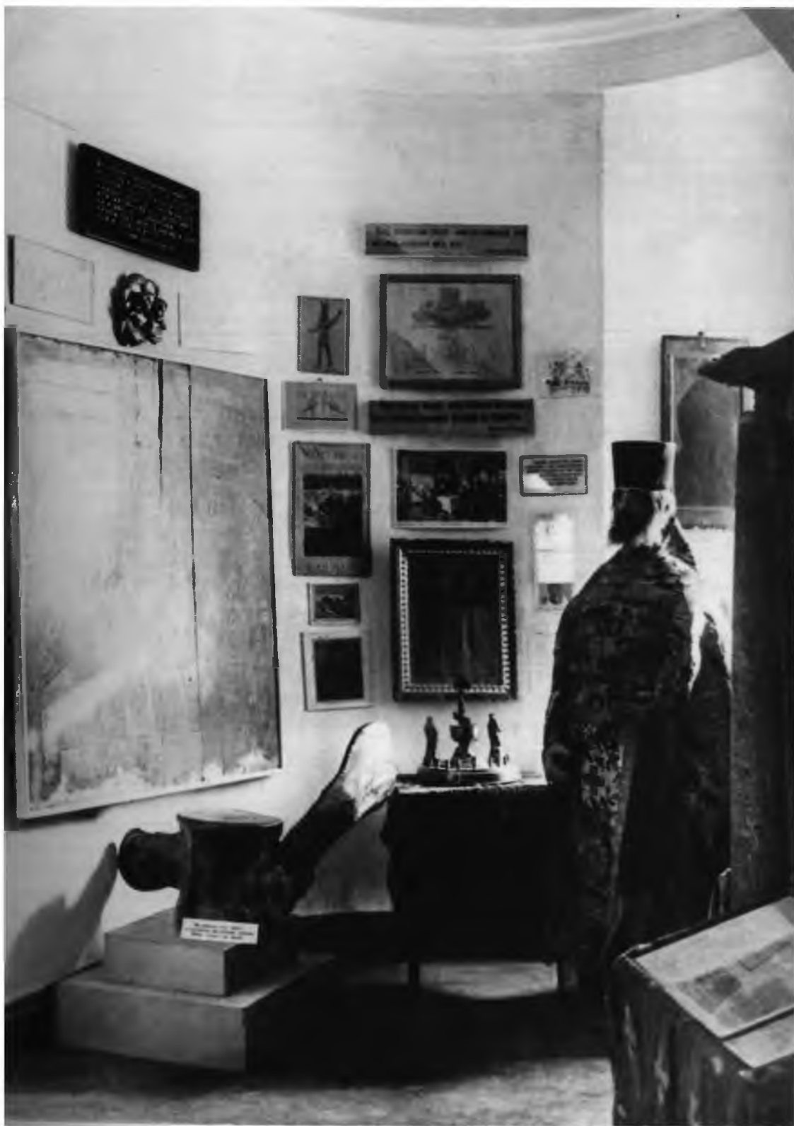
Антирелигиозная выставка. 1941 г.