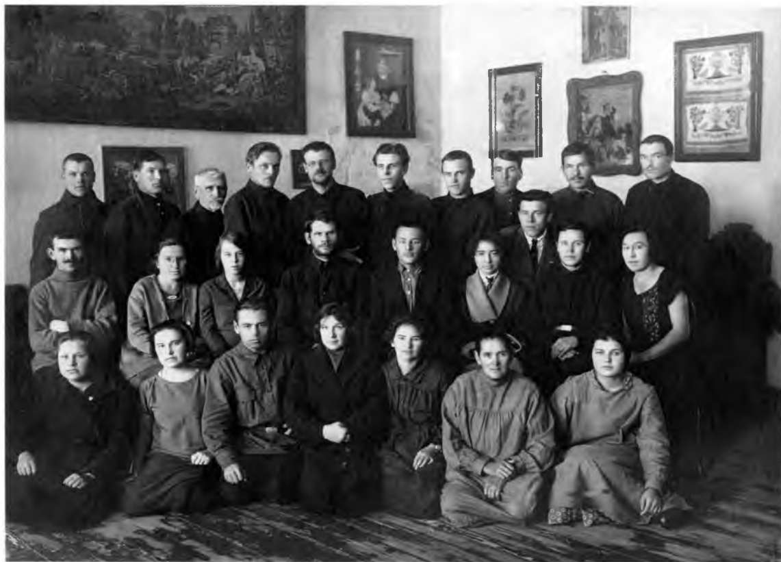
Сотрудники музея и Архивного бюро. Конец 1920-х — начало 1930-х гг.

для горячего протеста со стороны Вологодского государственного областного музея стали действия П.Д. Барановского. Он вывез из Грязовецкого музея и уезда ряд предметов без ведома и согласия учреждения, «фактически исполняющего функции по охране художественно-исторических памятников на территории губернии» 86 . Сам П.Д. Барановский в переписке с И.В. Федышиным по этому поводу замечает следующее: «Что касается Вашего сожаления о вывозе резных столбов из Обнорского монастыря в центр, то с точки зрения местных интересов я Вас вполне понимаю, но с точки зрения самого памятника Вы, безусловно, ошибаетесь...» 87 .