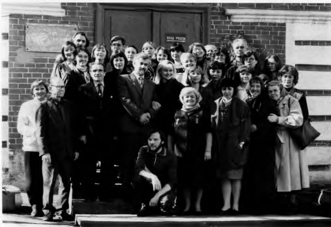
Сотрудники музея. 1993 г.

можно судить лишь по пробным реставрационным расчисткам, выполненным в разные годы, но значительная часть памятников таит под темной олифой и записями еще не доступную для изучения авторскую живопись.