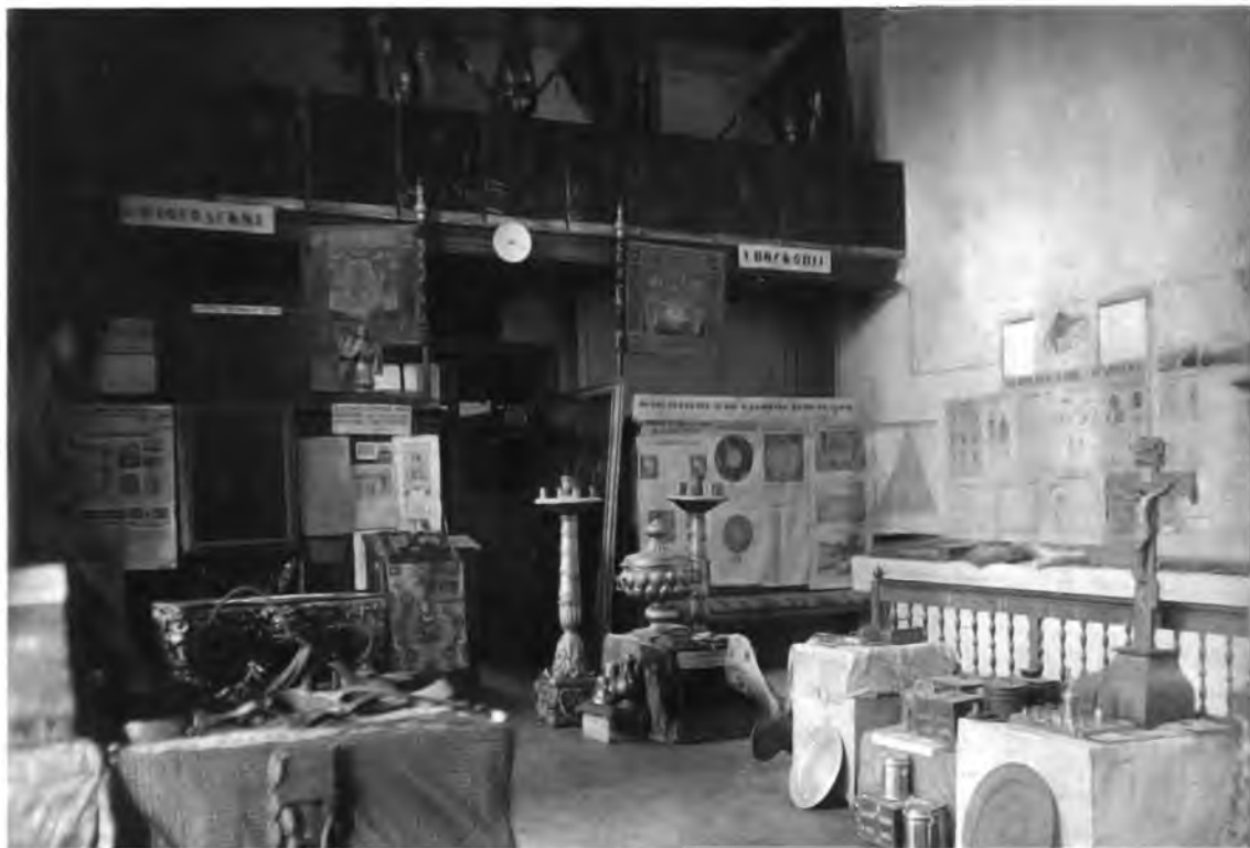
Выставка по истории религий. 1926—1927 гг.

образовавшегося в 1923 году государственно-объединенного музея. Икон в этом собрании, по-видимому, не было, несмотря на интерес членов кружка к памятникам архитектуры и церковным древностям.