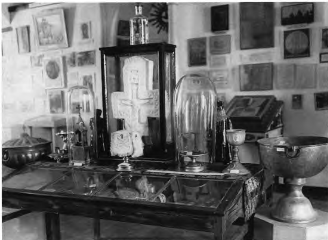
Антирелигиозная выставка. 1941 г.

Однако в отчете среди основных направлений деятельности музея первое место отводится комплектованию собрания и реставрации. Поскольку иконы поступают в коллекцию из закрытых церквей и монастырей бесплатно, «подотдел древнерусской живописи в музее легче, чем какой-либо другой, поставить на должную высоту в научно-художественном и краевом отношениях». Кроме того, именно в этой области искусства «местный край располагает достаточным количеством и разнообразием материала и наличием крупных местных мастеров древности, среди которых выделяется Дионисий Глушицкий (конец XIV — начало XV века) и Гринков (вторая половина XVI века)». Но поскольку «большинство ценных поступлений в настоящем своем виде не показательны», они «времененно до расчистки должны оставаться в фонде» 102 .