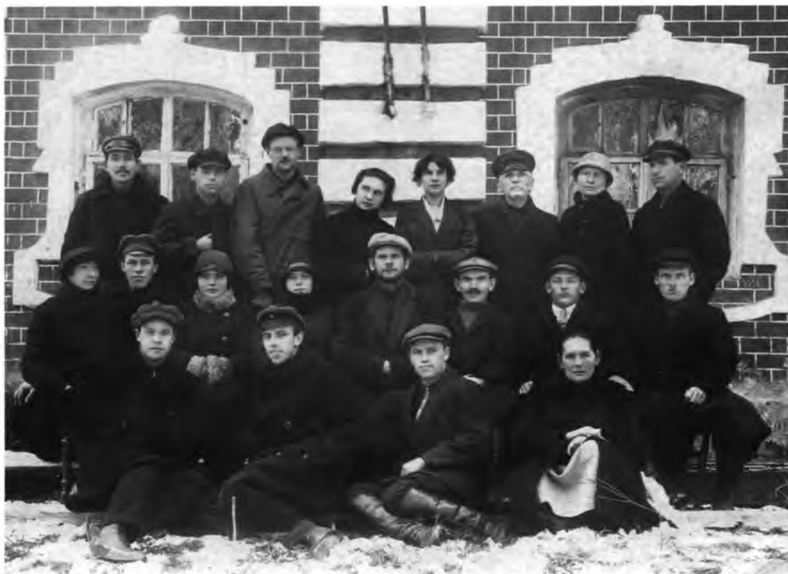
Сотрудники музея. Январь 1928 г.

также право изъятия памятников из действующих храмов и учреждений 81 .