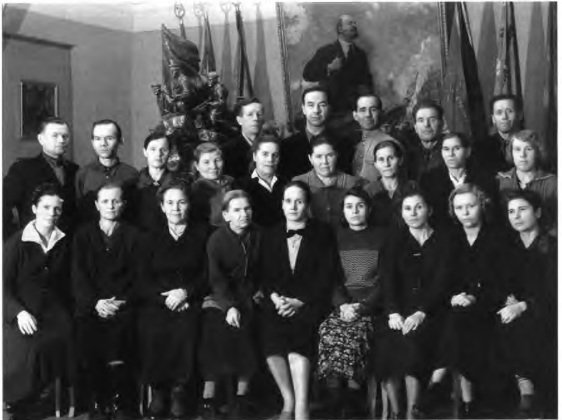
Сотрудники музея. 1950-е гг.

в Москву, что требовало больших затрат и ставило музей в крайне невыгодную ситуацию. В письме музея от 10 сентября 1929 года, адресованном вышестоящей организации, содержится просьба утвердить представленный список икон и высказывается несогласие с предлагаемой системой взаимоотношений музея с Главнаукой и Антиквариатом. Выдвигались следующие соображения: это «тормозит начатую работу по реализации икон и тем самым лишает Музей возможности своевременного получения средств, необходимых для дальнейшего обследования, охраны и собирания памятников искусства и старины на месте; во-вторых, переоценку икон московскими экспертами, если это необходимо, выгоднее произвести на месте, т.к. пересылка 250 икон в Москву для экспертизы потребует от Госмузея или Главнауки больших расходов, что, в общем, едва ли повысит намеченную на месте оценку икон; и, в-третьих, пересылка нерасчищенных икон в корне подрывает налаженную в Госмузее