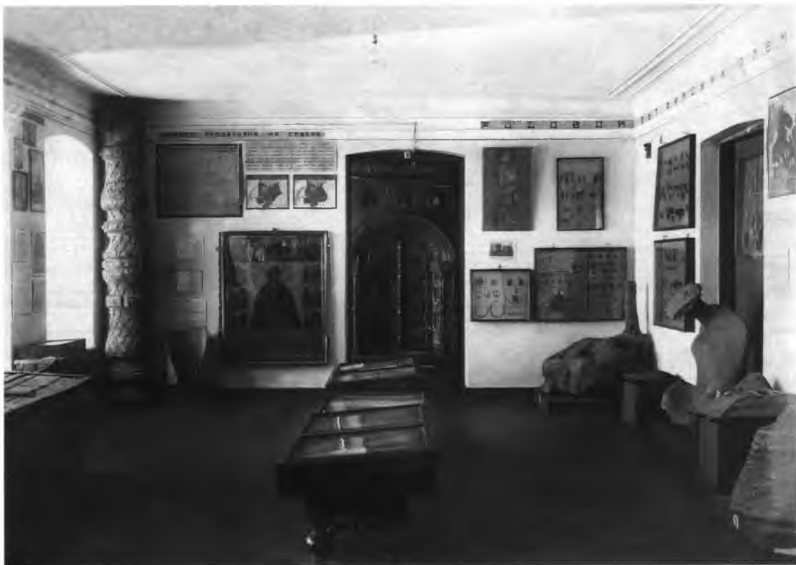
Экспозиция отдела истории. 1932 г.