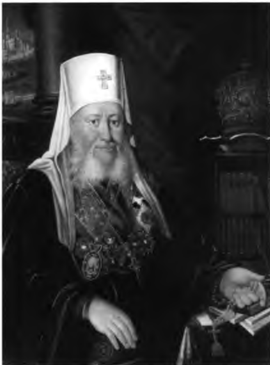
Евгений (Болховитинов), митрополит Киевский и Галицкий.