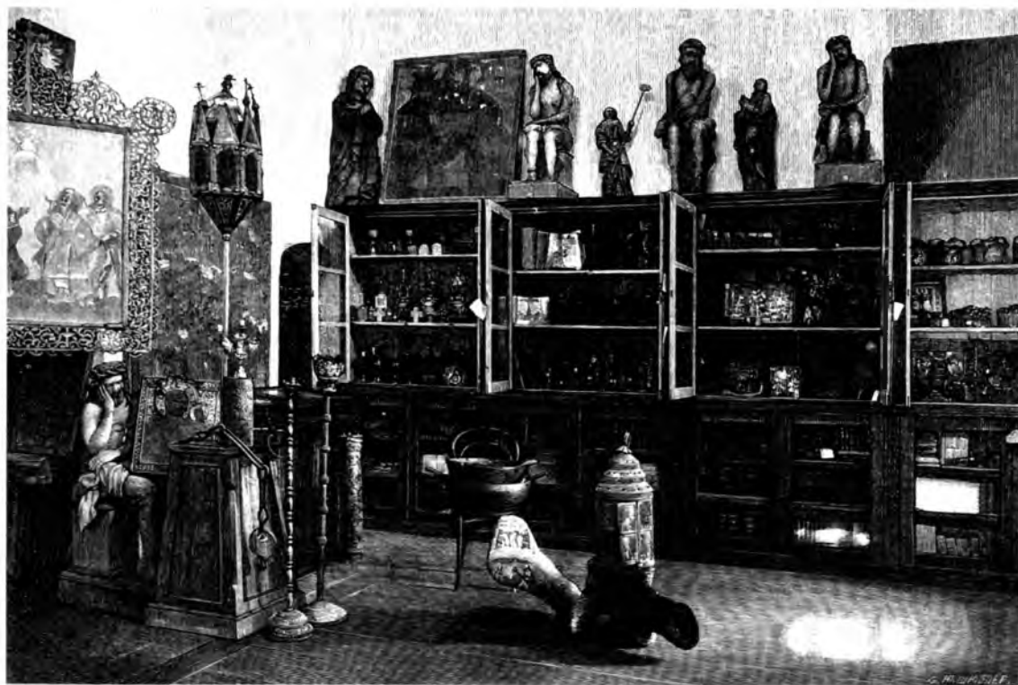
Экспозиция Вологодского епархиального древлехранилища. 1898 г.

дополнение в виде фотографий храмов и их интерьеров. В это время велась фотосъемка древностей и для научных целей: по просьбе члена Археографической комиссии известного историка Н.П. Лихачёва С.А. Непеиным — увлеченным фотографом-любителем — была выполнена съемка ценных памятников палеографии из коллекции Древлехранилища 46 . В собрании Вологодского музея-заповедника хранится более сорока его фотографий и негативов, многие из которых вошли в различные издания и широко известны. Разумеется, это не единственный фотограф, запечатлевший памятники архитектуры и их убранство. В коллекции музея имеются снимки других фотографов конца XIX — первой четверти XX века: Л.В. Раевского, Л.Ф. Корчагина и К.А. Баранеева, В.Ф. Гончарука и И.И. Громова. Сохранились и отдельные кадры фотосъемки московского иконописца и реставратора М.О. Чирикова. Благодаря их усилиям до нашего времени дошли бесценные свидетельства об утраченных или перестроенных в советское время памятниках архитектуры, их интерьерах и настенной живописи.