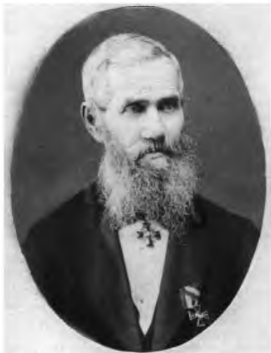
Н.И. Суворов. 1882 г.

ныне находится в собрании Вологодского государственного музея-заповедника.