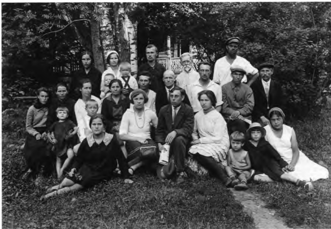
Сотрудники музея. Начало 1930-х гг.

Москвы и Ленинграда. В следующие десятилетия задачами огромной важности становятся ее сохранение, реставрация и систематизация. В те годы широко практиковались изъятия и «обмены» между столичными и провинциальными музеями 93 , не всегда возвращались иконы из центральных реставрационных мастерских и с зарубежных выставок 94 .