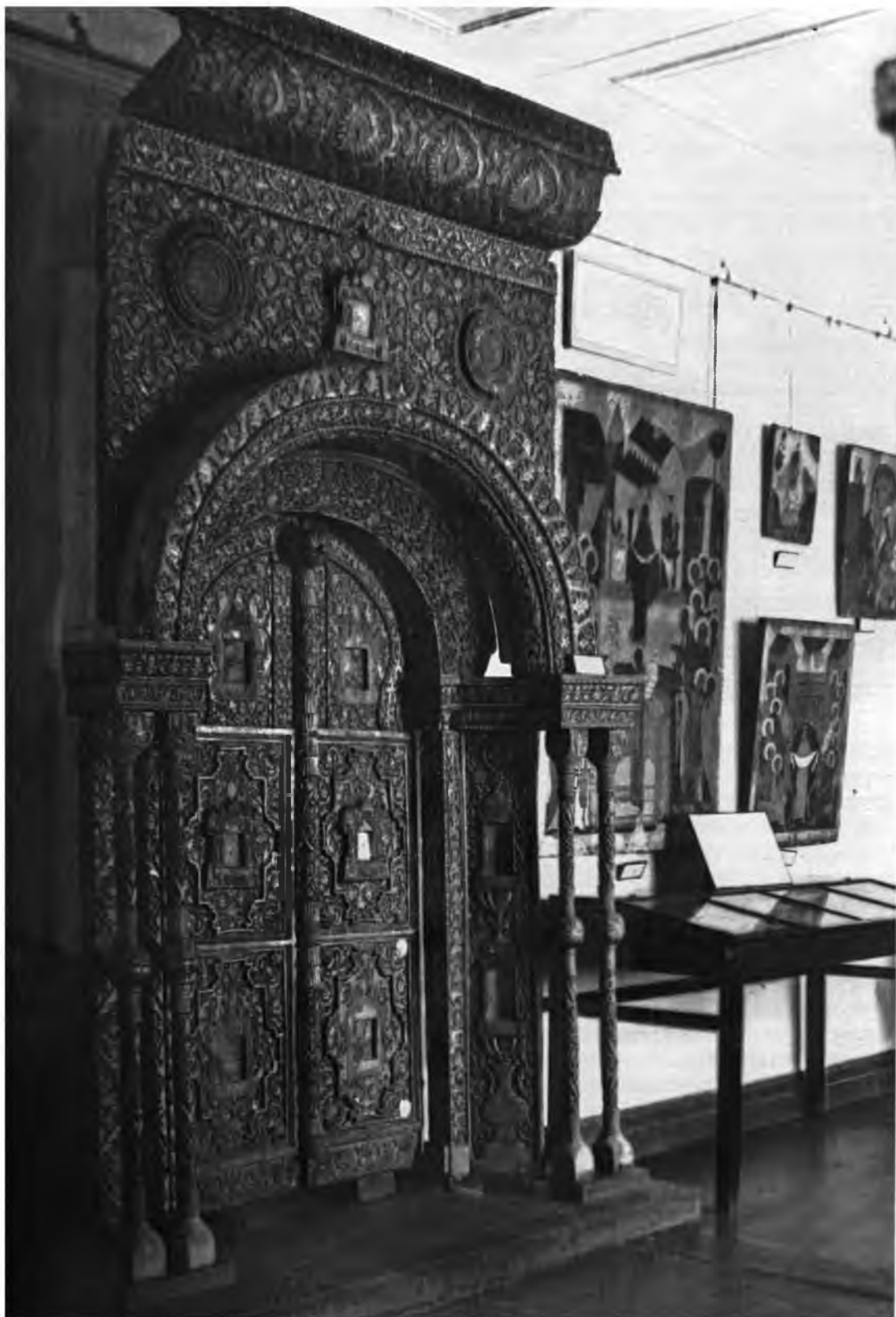
Экспозиция отдела истории. 1956 г.