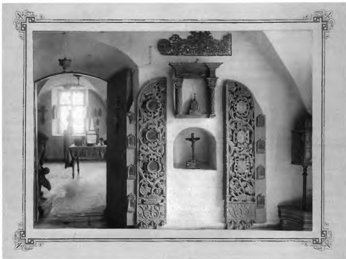
Выставка церковной старины в Экономском корпусе. 1920—1926 гг.

музею в 1911—1923 годах. Произведений иконописи среди них немного — это двенадцать памятников, поступивших в 1915—1923 годах. О них почти ничего не известно — записи о дарениях 65 не дают информации о размерах предметов, происхождении, а порой и о сюжетах. Поскольку музей не ставил своей целью комплектование художественных коллекций, поступления икон носили случайный характер.