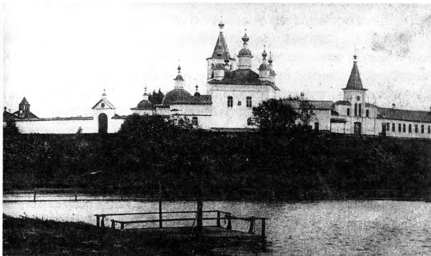
Илл. 1. Филиппо-Ирапская Свято-Троицкая пустынь. XVI–XIX вв. Фото начала XX в.

Одним из ценных историко-архитектурных памятников Русского Севера является монастырь прп. Филиппа Ирапского, находящийся в Кадуйском районе Вологодской области, на берегу реки Андоги. Его ансамбль формировался на протяжении XVI — начала XX вв. (Илл. 1)