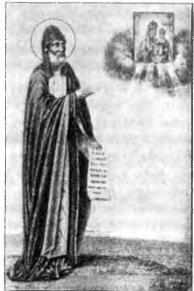
Преп. Θεодосіі Тотемскій.

2) Соборная церковь Преображенія Господня, строенная въ 1789 г. съ тремя престолами. Здѣсь находятся гробницы двухъ Вологодскихъ архіереевъ, 3) церковь Успенія Богоматери, построена на мѣстѣ небольшой оградной башни въ 1870 г. Кромѣ этого въ оградѣ три корпуса