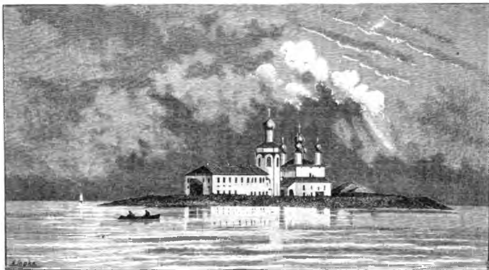
Спасо-Каменный Нубенскій монастырь.

поставить церковь и монастырекъ. 6-го августа воины прибили княжескія ладьи къ каменному островку, гдѣ были деревья. На островкѣ жили человекъ двадцать отшельниковъ, занимавшихся обращеніемъ въ христіанство язычниковъ. При бѣдности они не имѣли церкви и молились въ маленькой часовенкѣ. Князь приказалъ построить здѣсь храмъ Преображенія и затѣмъ вскорѣ воротился сюда съ иконами, книгами и церковной утварью. Такимъ образомъ возникъ монастырь. Здѣсь въ монастырѣ были сынъ Василія Темнаго, Андрей Васильевичъ и Василій Іоанновичъ, отецъ Грознаго. Обитель горѣла нѣсколько разъ, такъ что въ 1774 году Вологодская консисторія упразднила обитель. Но противъ этого горячо ходатайствовали всѣ сословія и въ 1800 г. указомъ Павла I обитель была вновь возстановлена.