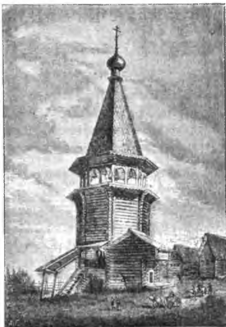
Колокольня Н.-Уфтыгскаго погоста. (Къ стр. 128).

Одна изъ древнѣйшихъ построекъ, церковь Владимірской Божіей Матери на Бѣлослужкомъ погостѣ (Сольвычегодскаго уѣзда, Вологодской губерніи), построенная въ 1642 году. Церковь эта представляетъ одинъ изъ замѣчательнѣйшихъ образцовъ развитія въ древности на Руси деревяннаго зодчества. Помимо художественной стороны, зданіе это интересно и по огромнымъ размѣрамъ. Высота всей церкви около 30 саж. Шатеръ, рубленый, бревенчатый до 30 арш. вышины. Ширина восьми-