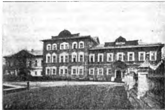
Епархіальное женское училище.

Въ настоящее время монастырь занимаетъ четырехугольную площадь, обнесенную со всѣхъ сторонъ каменной оградой, на протяженіи 365 саж. съ 4 башнями. Съ востока въ монастырь ведутъ св. врата. Середина монастырской площади занята огородомъ и садомъ. Широкая аллея ведетъ къ главнымъ храмамъ. На пути къ нимъ на лѣво стоитъ церковь Алексія чел.