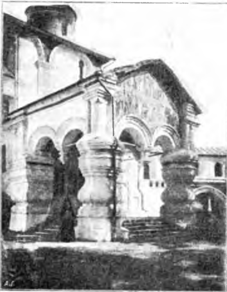
Входъ въ Спасо-Прилуцкій монастырь.

Главный храмъ весьма величественъ, въ два этажа, въ каждомъ нѣсколько придѣловъ.