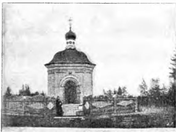
Часовня Стефана Комельскаго.

Земли отобрали. Въ теченіи времени церковь полуразрушилась такъ, что окрестное населеніе стало хлопотать объ ея возобновленіи, что и было сдѣлано въ 1852 году. Въ 1861 г. бывшая упраздненная обитель была приписана къ Вологодскому Успенскому женскому монастырю. Черезъ два года послѣ этого, когда обитель была формально причислена, въ ней были сдѣланы необходимыя по-