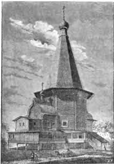
Храмъ Владимірской Божіей Матери на Бѣло-случномъ погостѣ. (Къ стр. 127.)