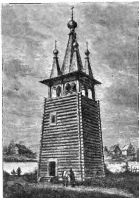
Колокольня Ракунскаго погоста. (Къ стр. 128).

угольника болѣе 8 сажень. Церковь на подклѣтяхъ и входъ—что представляетъ весьма рѣдкій случай—съ южной стороны. Галлерея съ трехъ сторонъ, для защиты отъ вѣтру съ маленькимъ окномъ. Во второмъ этажѣ надъ галлерей какъ и въ пристройкѣ къ восьмиугольнику, второй придѣлъ съ папертью. Лѣстница въ этотъ придѣлъ идетъ изъ галлерейки. Церковь холодная и потому вмѣсто трапезной (въ теплыхъ церквахъ трапезная—одна изъ главныхъ принадлежностей)—галлерея, которая теперь частью разрушена, да и вся эта замѣчательная церковь, къ сожалѣнію, подлежитъ сломкѣ, и рисунокъ нашъ скоро будетъ имѣть интересъ уже историческій: изображенія уже несуществующаго памятника зодчества.