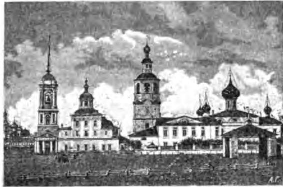
Храмы Спасо-Обыденнаго и Николая Чудотворца въ Вологдѣ.

Въ началѣ второй половины XVII вѣка, во время царствованія Алексѣя Михайловича, съ 1 сентября 1665 г. страшная моровая язва опустошала какъ самую Вологду, такъ и ея окрестности. Народъ, видя какъ смерть ежедневно уноситъ множество жертвъ, впалъ въ какое-то тупое отчаяніе; общественная жизнь какъ бы замерла, но благочестіе воскресло съ новой силой; всѣ постились, молились, наполнили храмы Божіи съ утра до вечера, между тѣмъ язва продолжала свирѣпствовать.