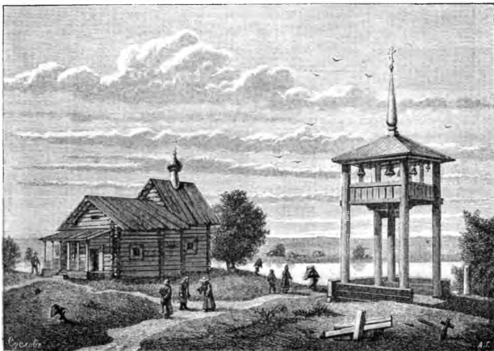
Церковь Богоматери на Волчьемъ ручьѣ. (Къ стр. 126).

опушены тесами и окрашены бѣлою краскою. Высота церкви съ крестомъ около 19 саж., длина съ алтаремъ и притворомъ около 13 и ширина около 7 сажень. Для входа устроено съ наружи большое, крытое тесомъ крыльцо, затѣмъ въ притворѣ направо и налево лѣстницы—каждая по 6 саж. длины, ведущія въ верхнюю паперть. Внутренняя стѣна, отдѣляющая эту паперть отъ самаго храма, имѣетъ форму полукруга, обращеннаго выпуклостью во внутрь паперти и имѣющаго три двери: сѣверная, восточная и южная. Восточная дверь представляетъ главный входъ и отстоитъ отъ задней стѣны только на три сажени, тогда какъ сѣверная и южная малыя двери въ узкихъ концахъ паперти отстоятъ отъ задней стѣны почти на семь сажень и ведутъ въ храмъ справа и слѣва не въ дальнемъ разстояніи отъ клиросовъ. Иконостасы какъ въ самомъ храмѣ, такъ и въ паперти старые, но живопись еще свѣжа и сохраняетъ свою художественную прелесть. Престоль въ церкви одинъ—во имя Покрова Божіей Матери.