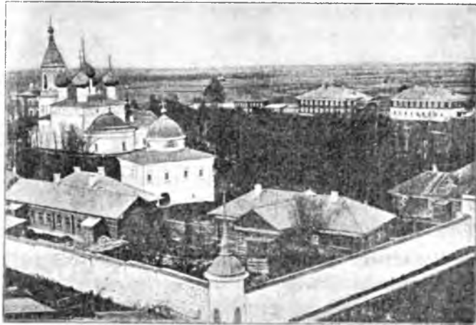
Успенскій Вологодскій монастырь.

вслѣдствіе пожара архива въ 1762 г. мало известна. Остались лишь двѣ грамоты, (позднѣйшая 1613 года). Обитель въ 1824г. посѣтилъ Александръ I-й; крайняя ветхость и скудость монастыря въ то время побудила монарха оказать оби-