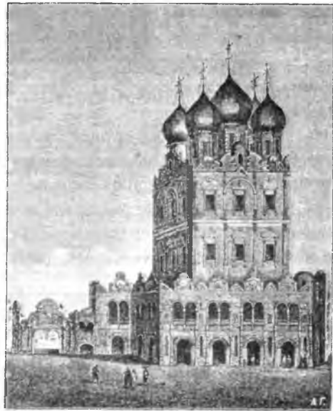
Введенскій монастырь г. Сольвычегодска.

Введенскій монастырь находится въ самой срединѣ г. Сольвычегодска, основанъ въ 1563 году, тремя братьями: Яковомъ, Семеномъ и Григоріемъ Строгановыми. Вначалѣ они построили деревянную церковь во имя Введенія Пресвятыя Богородицы, отчего и монастырь получилъ свое названіе. Въ 1594 году, Никита Строгановъ построилъ еще три деревянныхъ храма. Въ 1688 г. всѣ зданія сгорѣли и тогда Григорій Дмитріевичъ Строгановъ началъ постройку каменной церкви. Церковь строилась восемь лѣтъ и очень замѣчательна въ архитектурномъ отношеніи. Рѣзная работа иконостаса выполнена Московскимъ мастеромъ, иконы писаны въ 1693 году съ картинъ самыхъ знаменитыхъ художниковъ. Въ основаніи своемъ, храмъ Введенія имѣетъ форму квадрата и высится громадной четырехугольной башней, имѣющей ширину 8 саж. съ каждой стороны. Надъ плоской кровлей пять грушевидныхъ куполовъ. На кровлѣ устроена обширная терасса, откуда открывается великолѣпный видъ на весь городъ и его окрестности. На сѣверо-западъ, отъ главнаго храма, возвышается колокольня, построенная въ нынѣшнемъ столѣтіи. Монастырь обнесенъ каменной, невысокой оградой. Весь монастырь покрытъ зеленью, среди которой мелькаютъ каменные и деревянные келіи для настоятеля и братіи, которой въ монастырѣ 15 человекъ.