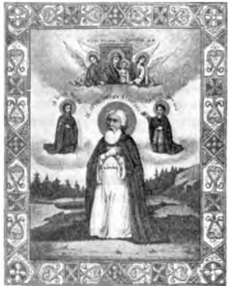
Св. Пр. Іосифъ Вологодскій.

Въ 1588 году на этомъ мѣстѣ явилась одному крестьянину дер. Обухово, Илларіону, икона Божіей Матери Казанской и св. Безсребренниковъ Космы и Даміана. Было это въ день празднованія Владимірской Божіей Матери 23 іюня. Немедленно Илларіонъ водрузилъ на этомъ мѣстѣ крестъ и возлѣ него поставилъ явленную икону, затѣмъ устроилъ здѣсь часовню и водворился при ней на жительство. О чудесахъ новоявленной иконы узналъ тогдашній епископъ Вологодскій Антоній и разслѣдовавъ дѣло, благословилъ на томъ мѣстѣ воздвигнуть храмъ и устроить монастырь. Здѣсь же Илларіонъ принялъ иноческій санъ съ именемъ Іосифа и прожилъ въ обители 25 лѣтъ, Своей подвижнической жизнью онъ удостоился названія преподобнаго. Послѣ его смерти многіе получали исцѣленіе отъ гроба.