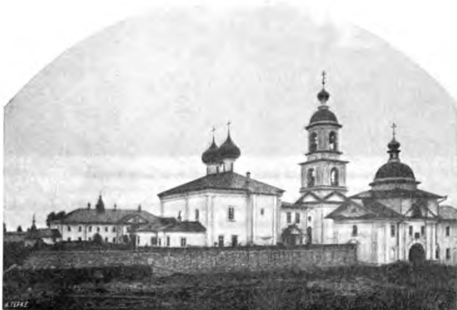
Діонисіево-Глушицкій монастырь съ сѣверо-восточной стороны.

двѣ приходскія церкви. Не терпя славы за свои подвиги, пр. удалился изъ Покровскаго монастыря за 4 версты, гдѣ и сдѣлалъ себѣ подъ толстой сосной кушу, отъ чего это мѣсто прозвали Сосновицы. Такъ какъ онъ ушелъ изъ своего монастыря тайно, то братія нашедши его стала упрашивать не покидать ихъ. Преподобный согласился, но часто приходилъ сюда молиться, а потомъ устроилъ здѣсь церковь, келіи, и переселилъ часть братіи, назвавъ это вторымъ монастыремъ и завѣщавъ, чтобы они съ его Покровскимъ, управлялись однимъ настоятелемъ. За 7 лѣтъ до смерти преподобный самъ выкопалъ себѣ въ этомъ монастырѣ могилу и завѣщалъ похоронить его здѣсь.