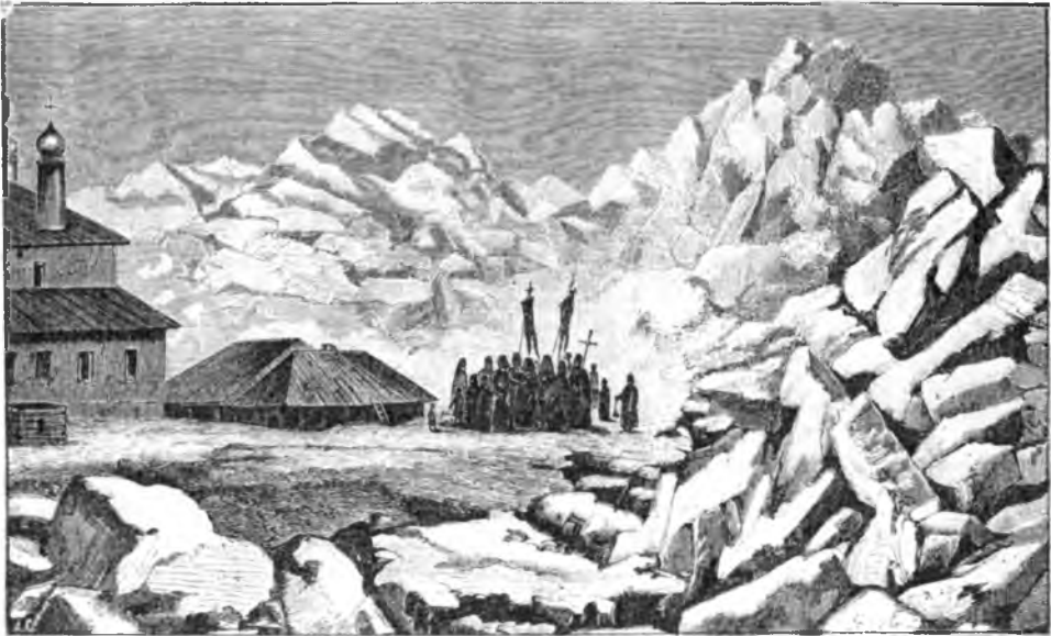
Спасо-Каменный Нубенскій монастырь во льдахъ. (Рис. къ стр. 103).