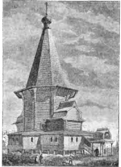
Храмъ Успенія на Троицкомъ погостѣ.

Церковь Успенія на Троицкомъ погостѣ, Вологодской губ., Сольвычегодскаго уѣзда. Представленная на нашемъ рисункѣ церковь Успенія на Троицкомъ погостѣ, Вологодской губ., Сольвычегодскаго уѣзда, построена въ XVII столѣтіи, какъ это замѣтно и по стилю ея архитектуры. Она стоитъ на высокихъ подклѣтяхъ и окружена съ трехъ сторонъ галлереей, имѣющей здѣсь мѣстное названіе нищевника. Высота церкви около 16 сажень. Шатеръ „рубленный“ покрытъ гонтомъ въ чешую. Такой типъ церковей вообще весьма распространенъ по всей Двинѣ; эти церкви носятъ названіе „холодныхъ“, такъ какъ теплая всегда представляютъ собою низкія постройки. Внутренность Успенской церкви не особенно объемиста; высота ея около восьми аршинъ отъ пола до потолка, выведеннаго сводомъ. Въ старину, какъ утверждаютъ, зданіе церкви было гораздо выше и она осѣла не менѣе, какъ аршина на четыре.