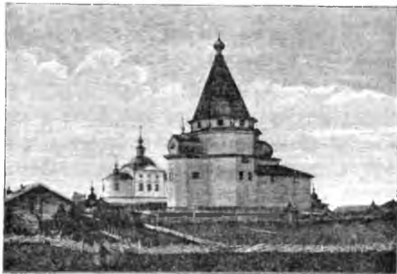
Явенгская Покровская церковь.

Явенгская церковь Зубовской волости. Храмъ, представляетъ собою типъ множества старинныхъ деревянныхъ церквей, разсѣянныхъ по громадному пространству Вологодской губерніи. Рисунокъ представляетъ церковь, выстроенную въ 1753 году во имя Покрова Пресвятыя Богородицы на возвышенномъ берегу рѣки Явенги, въ Зубовской волости, Кадниковскаго уѣзда, почему она и извѣстна подъ именемъ Явенгской Покровской церкви. За нею видна другая каменная церковь недавней постройки, не оставившей однакоже заботы прихода о поддержкѣ стариннаго деревяннаго храма, который (независимо отъ постройки каменной церкви) поновленъ былъ въ 1851 и 1881 гг., т. е. чрезъ 98 лѣтъ и чрезъ 128 лѣтъ, послѣ своего основанія. Обѣ церкви выстроены средствами и стараніями прихожанъ, состоящихъ почти исключительно изъ крестьянъ. Деревянная церковь стоитъ на живописномъ мѣстѣ. Внизу предъ нею извиаается рѣчка Явенга, окаймленная небольшими сосновыми перелѣсками, и изъ оконъ видно, какъ дальше таже рѣчка впадаетъ въ многоводную и широкую рѣку Кубину (протекающую по всему протяженію Кадниковскаго уѣзда). Церковь одноэтажная, но съ высокими подвалами, такъ что церковный полъ почти на четырехсаженной высотѣ надъ земною поверхностью, Стѣны и крыша