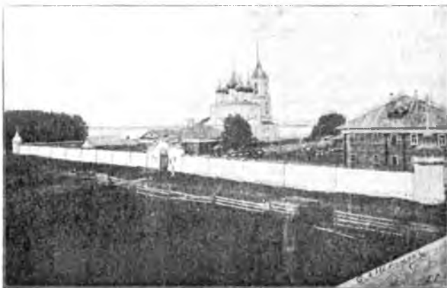
Николаевская Озерская пустынь.

Новую церковь построили надъ могилой преп. Въ 1741 г. эта церковь была замѣнена новой каменной двухъ-этажной. Ранѣе эта обитель имѣла большія вотчины и много крестьянъ. 1764 г. лишилъ обитель всего, такъ какъ обитель упразднили, а церковь обратили въ безприходную.