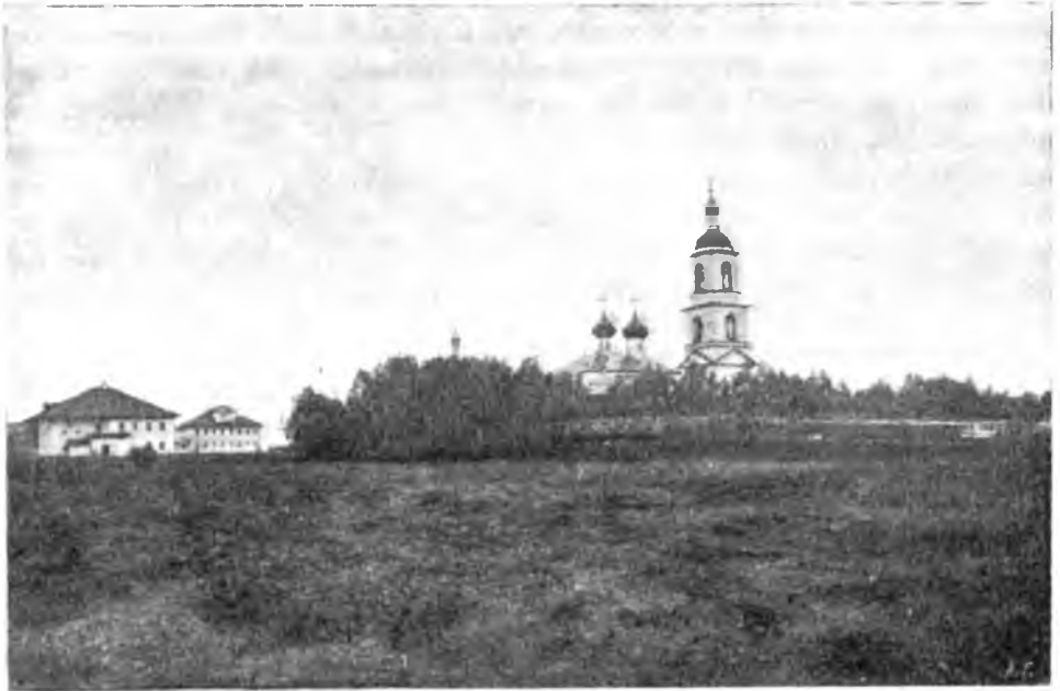
Діонисієво-Глушицкій монастырь съ сѣверо-западной стороны.

преп. Діонисія. Иконы его собственнаго письма и проч. Земли при монастыряхъ 149 дес.; монастырь занимается земледѣліемъ.