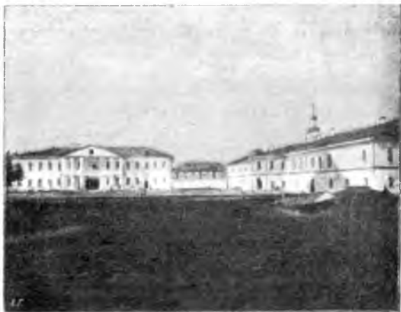
Успенская церковь Семигородной пустыни.

Во всемъ храмѣ нѣсколько придѣловъ. Видъ верхней церкви весьма живописенъ.