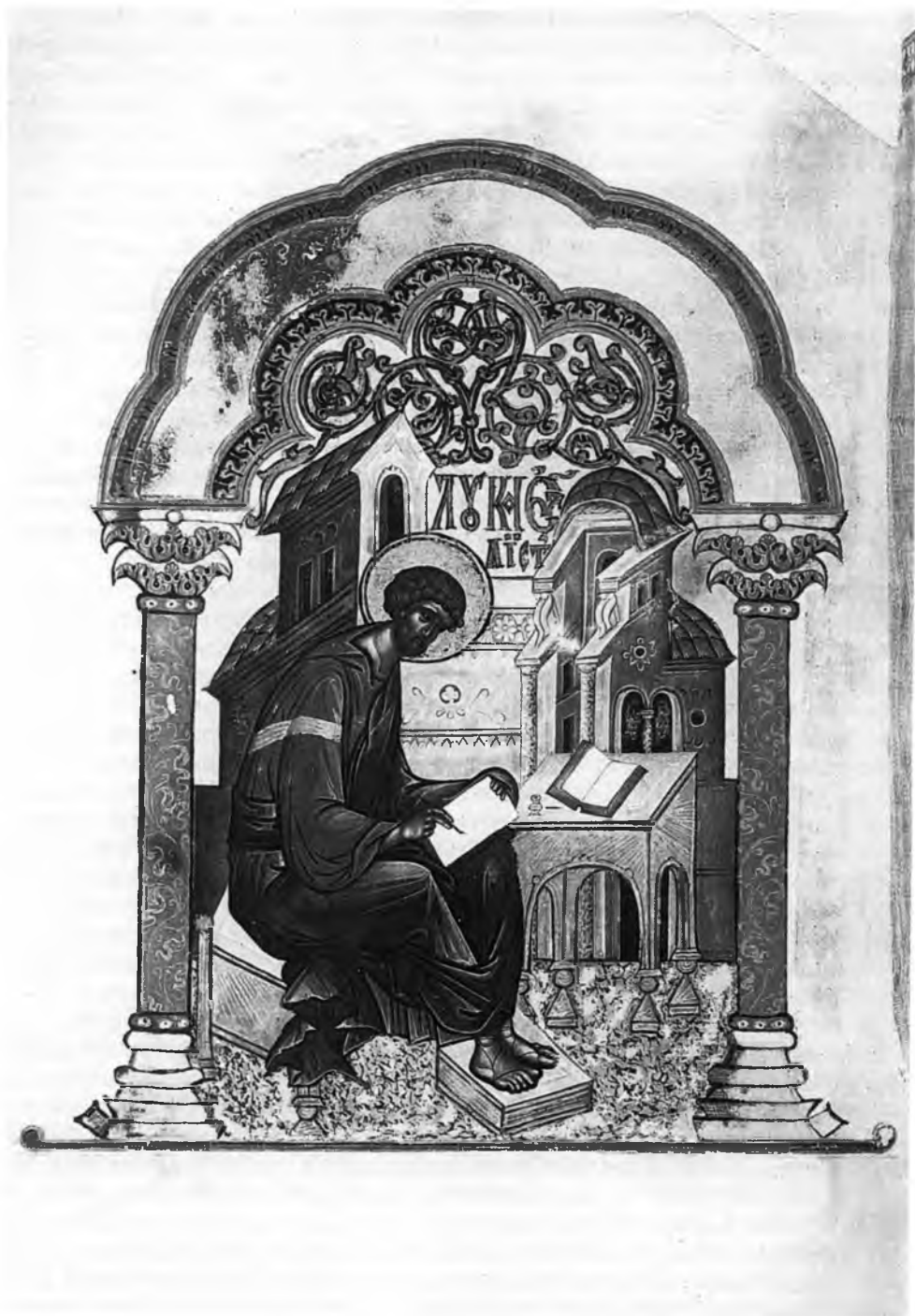
1. Апостол Лука.

Миниатюра. Деяния и Послания апостолов. 30-е гг. XVI в. ГИМ, Син. 13. Л. 3 об.