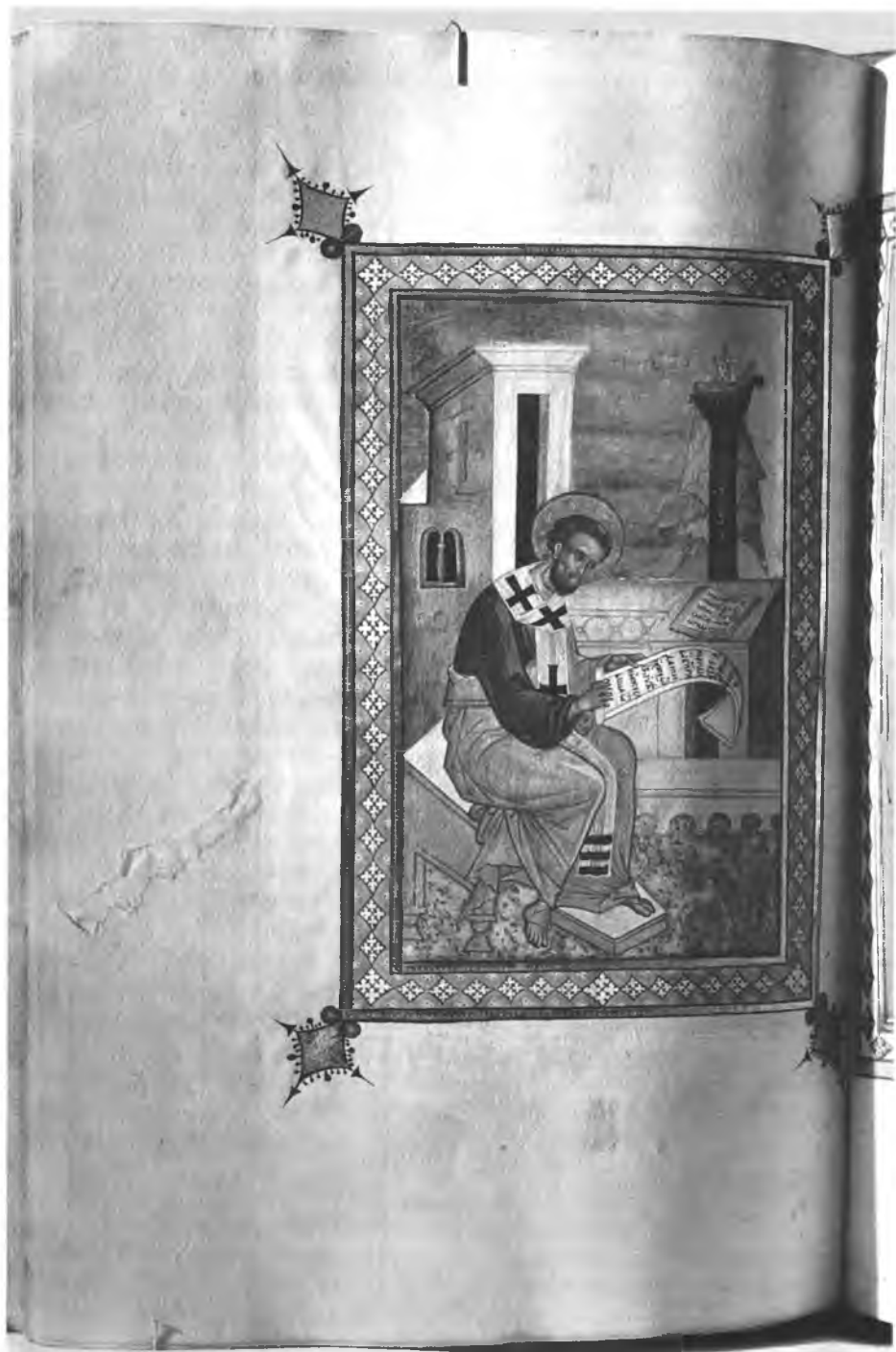
7. Апостол Тимофей. Миниатюра. Деяния и Послания апостолов. СПМЗ, № 46. Л. 448 об.