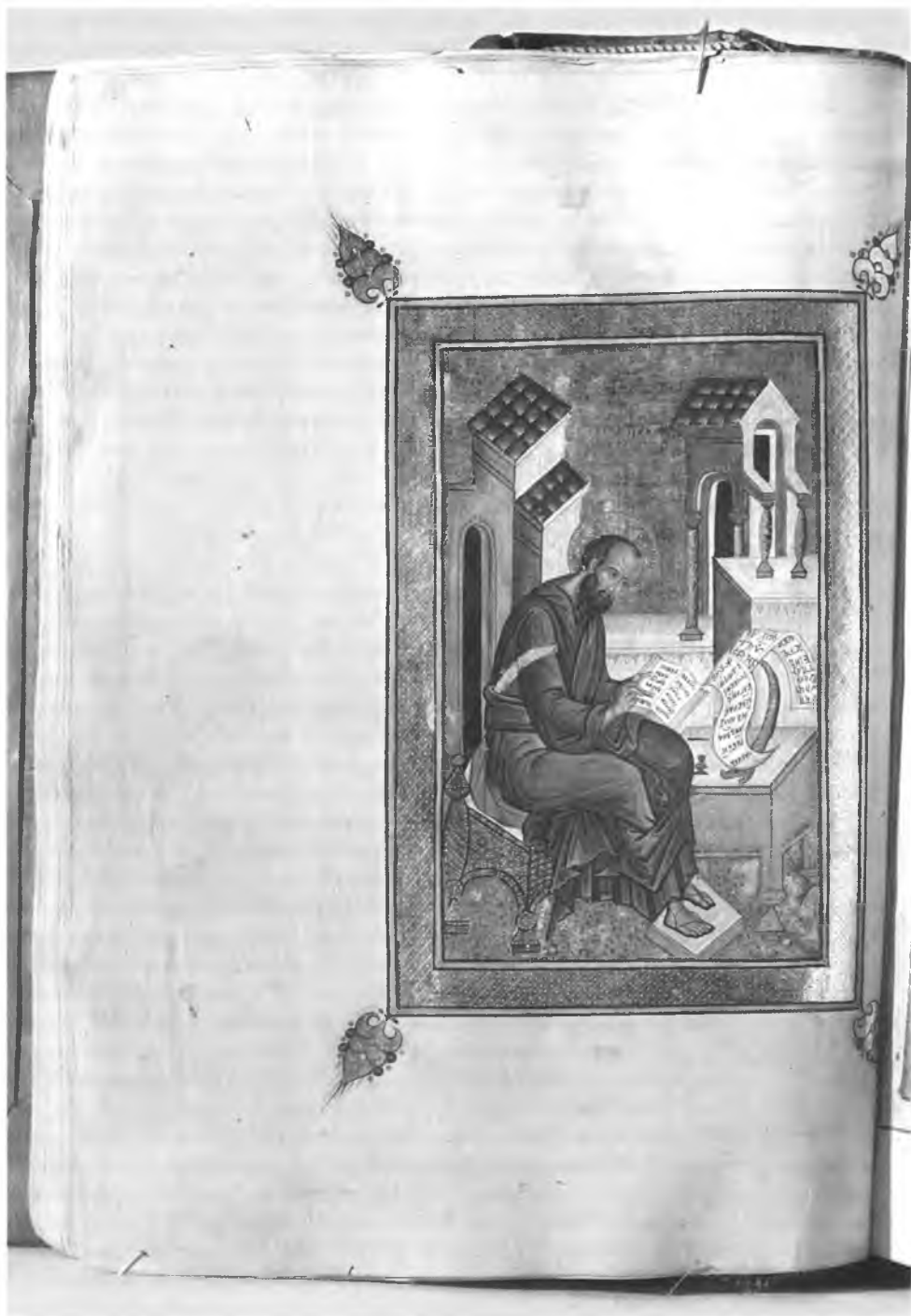
6. Апостол Павел. Миниатюра. Деяния и Послания апостолов. СПМЗ, № 46. Л. 227 об.