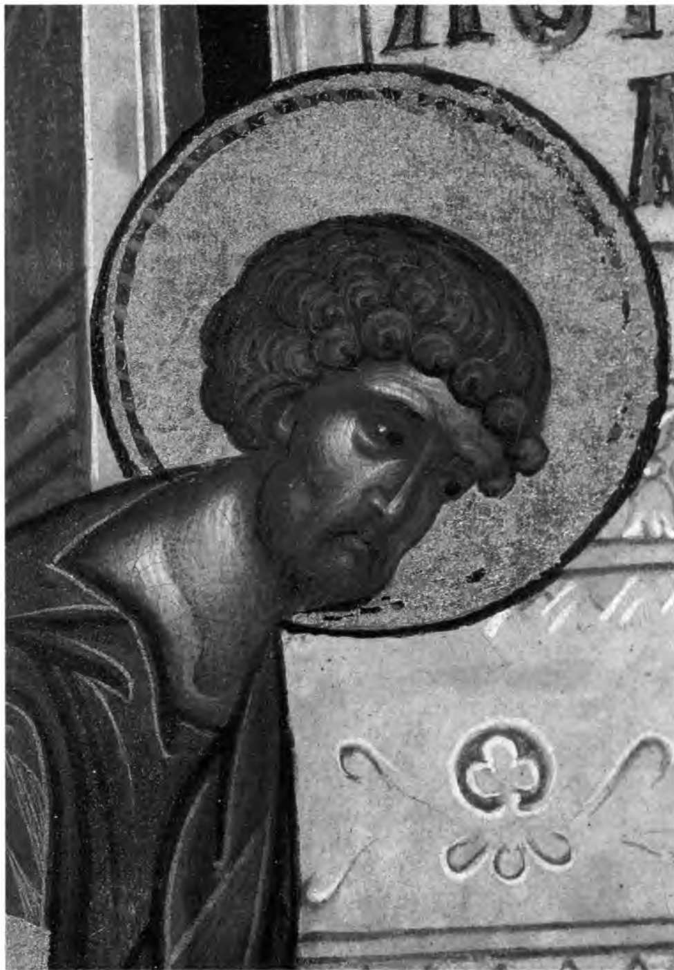
2. Апостол Лука. Деталь миниатюры. Л. 3 об.