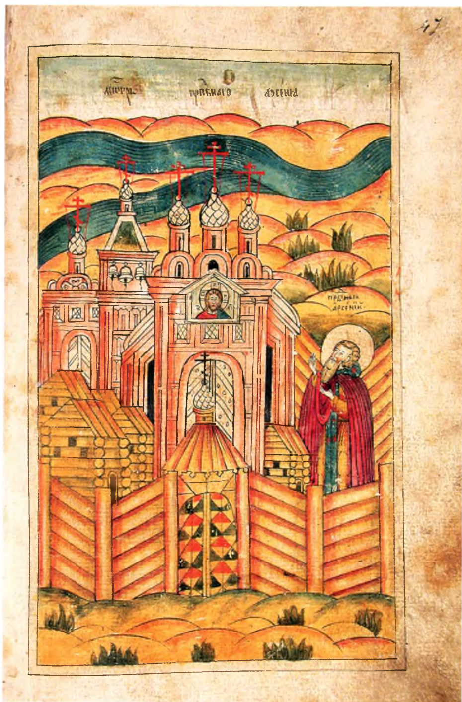
4. Преподобный Арсений в основанном им Комельском монастыре.