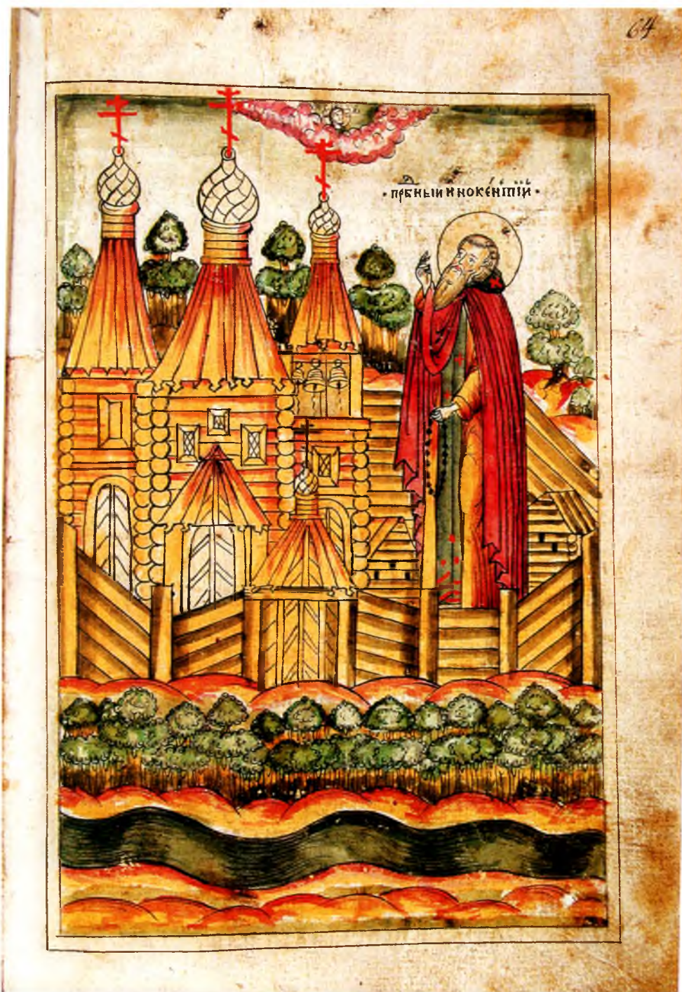
6. Преподобный Иннокентий в основанном им Спасо-Преображенском монастыре. Л. 64.