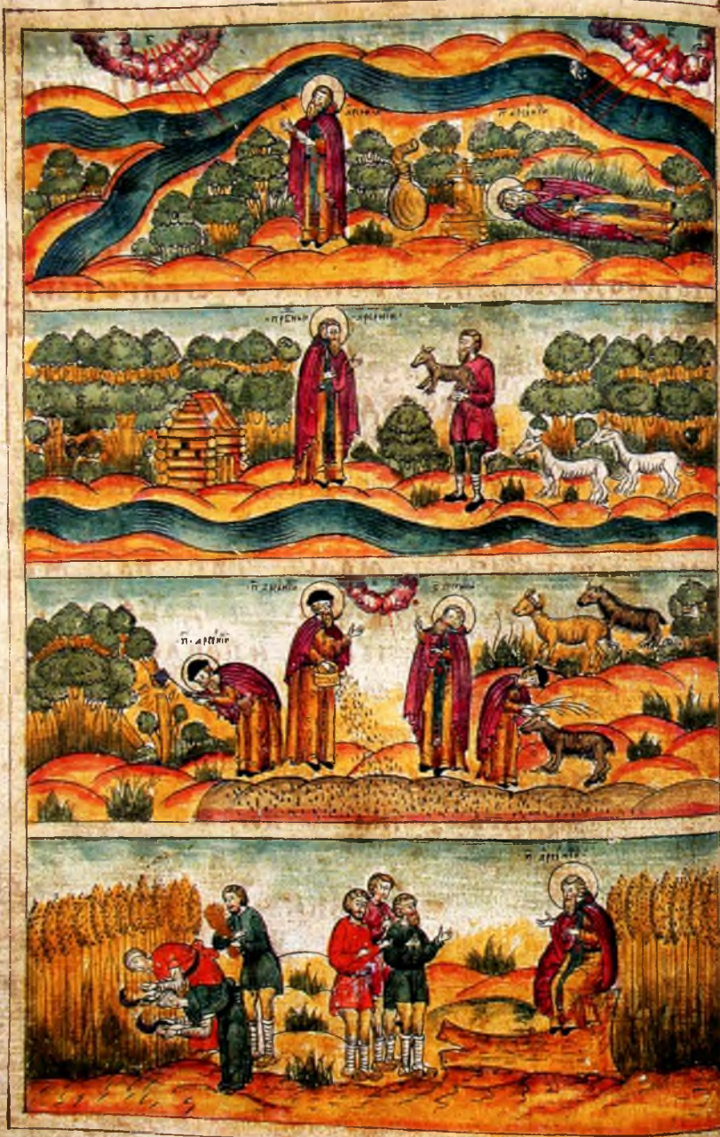
3. Преподобный Арсенией уходит в «пустыню»; строит себе келью; занимается подсечным земледелием.