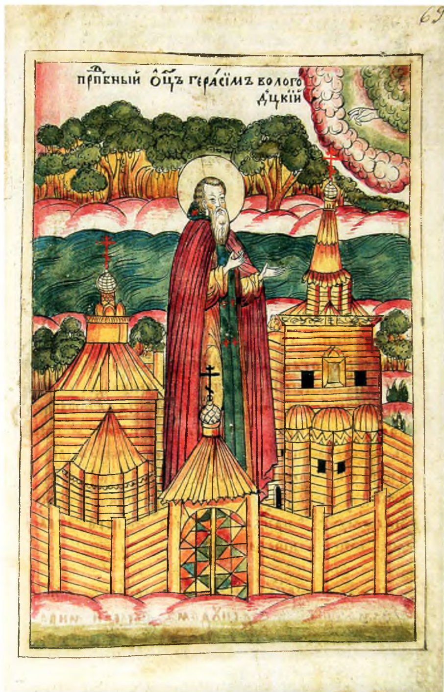
8. Преподобный Герасим на месте, где был скит, основывает Троицкий монастырь.