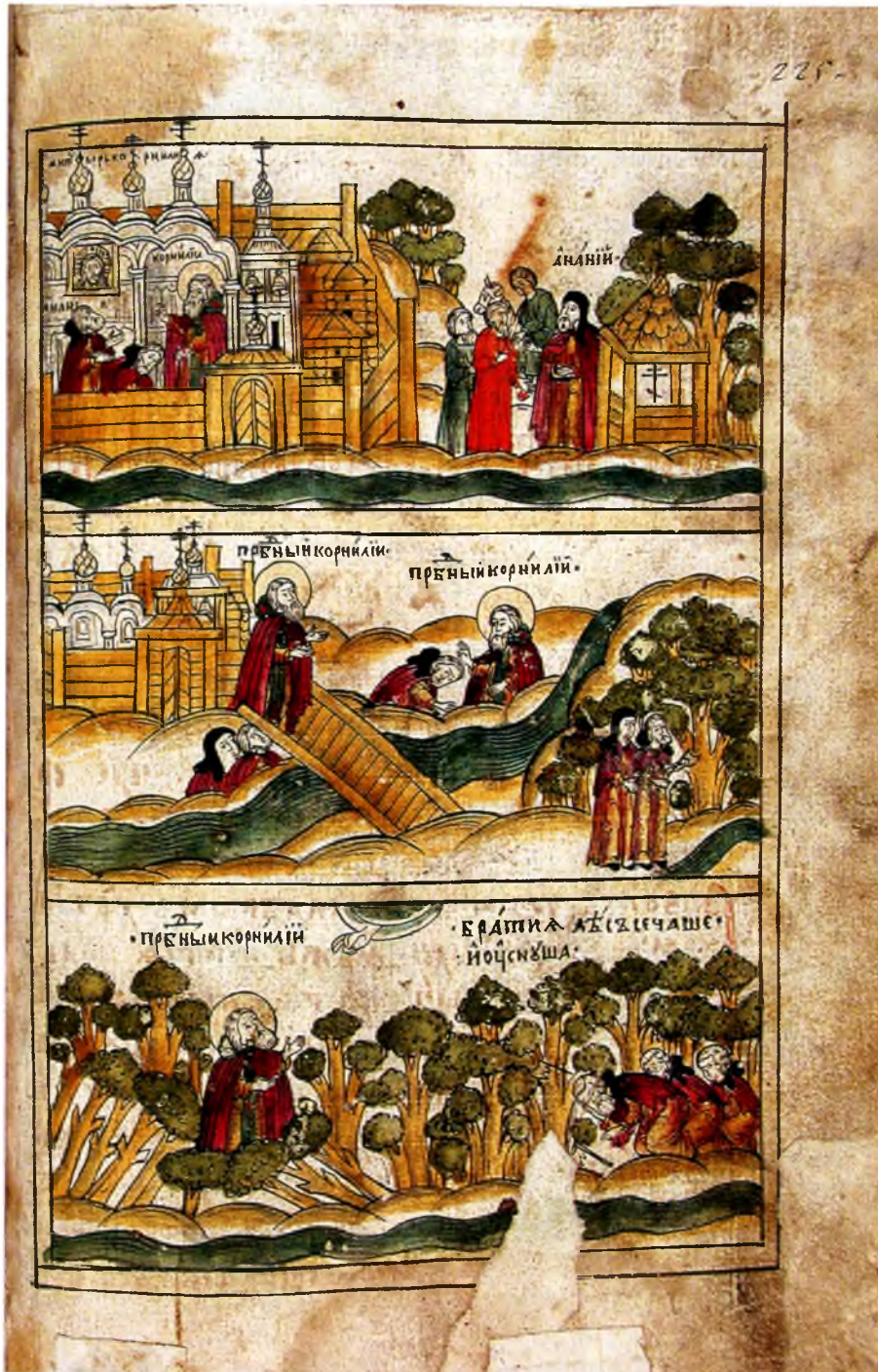
11. Прижизненные чудеса преподобного Корнилия: с монахом Аганием; с подпленным мостом; с монахами, собирающими хворост.