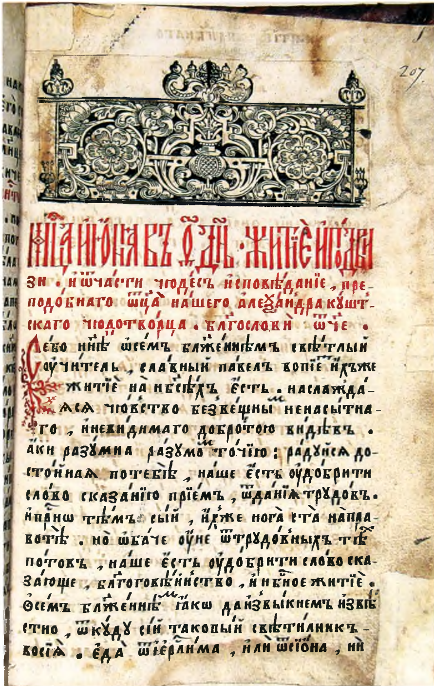
1. Сборник житий вологодских святых.

Лист с текстом и заставкой старопечатного стиля из печатного издания 1679–1695 гг.