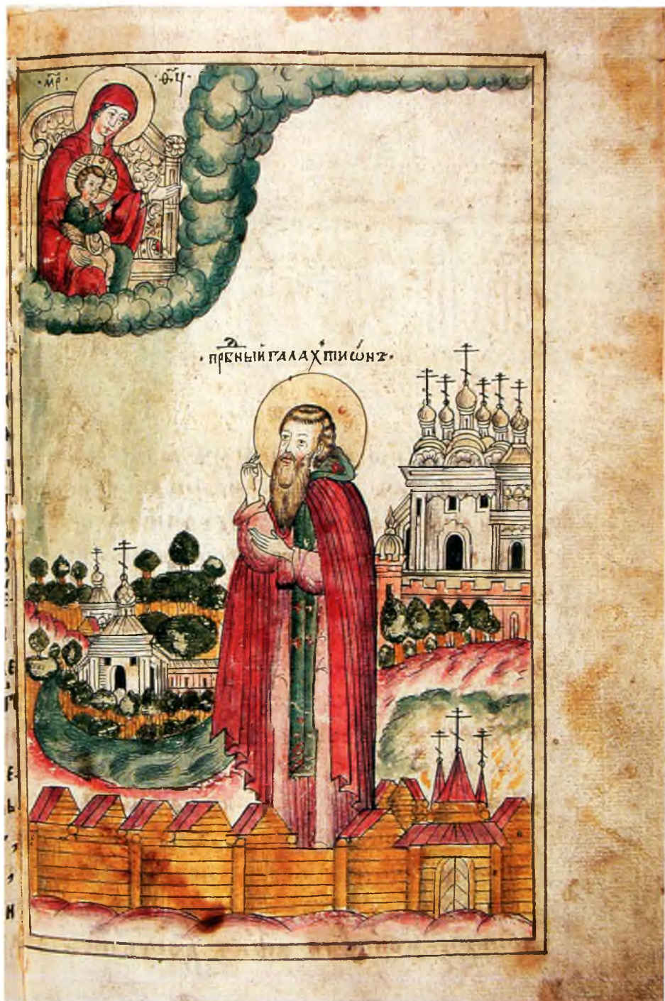
12. Преподобный Галактион в монастыре. Л. 302.