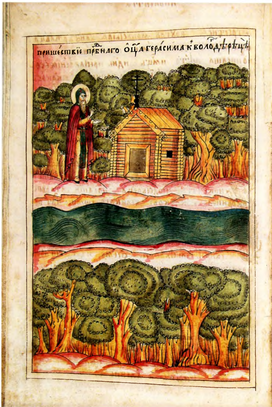
7. Преподобный Герасим на реке Вологде строит себе келью. Л. 68 об.