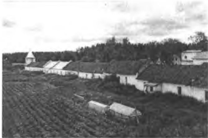
Филиппо-Ирапская пустынь. 1996 г.