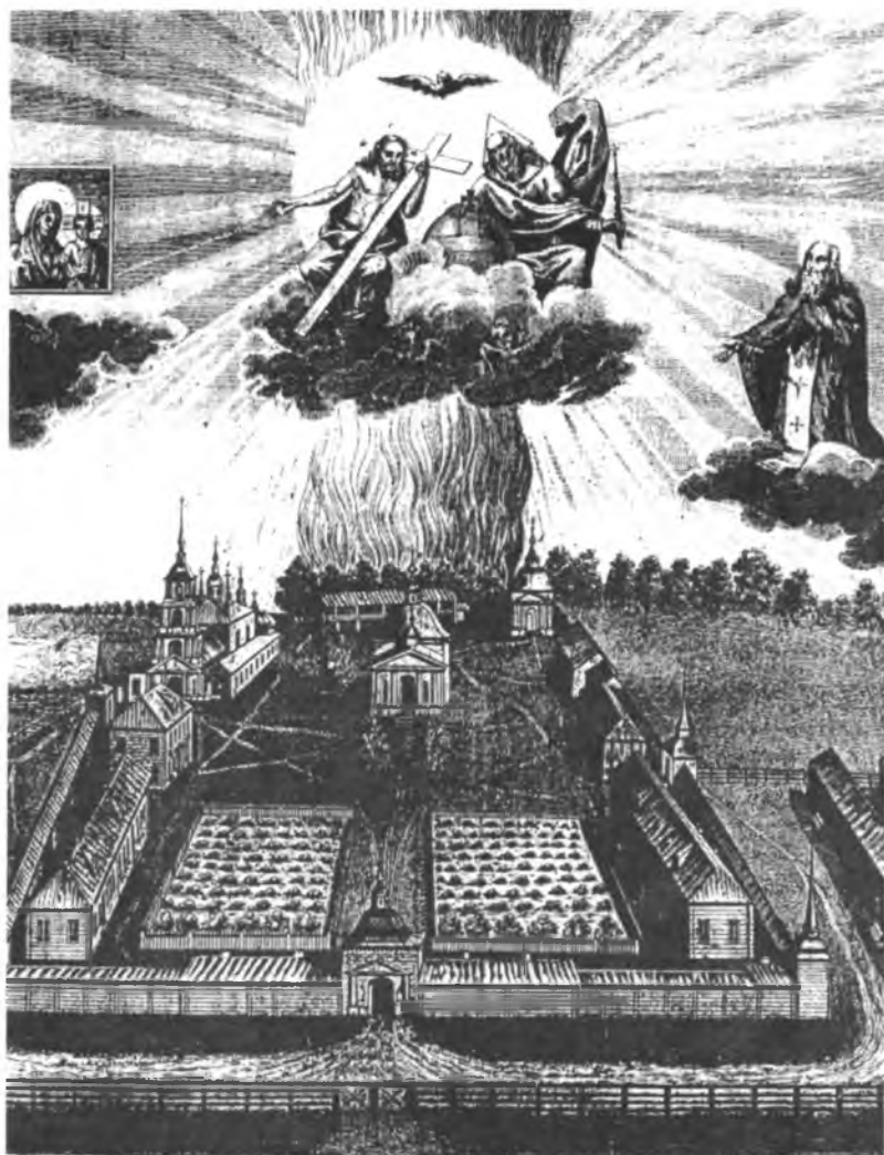
ИЗОБРАЖЕНИЕ СВЯТОТРОИЦКІЯ ФИЛІППОВСКИЯ ПУСТЫНИ.