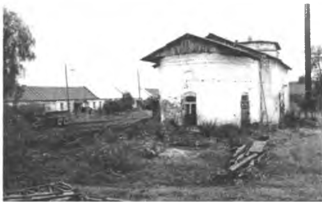
Филиппо-Ирапская пустынь. 1996 г.

Объемная композиция собора решена достаточно необычно: небольшой храм с очень высоким сомкнутым сводом и удлиненной, большой апсидой, перекрытой также высоким сводом.