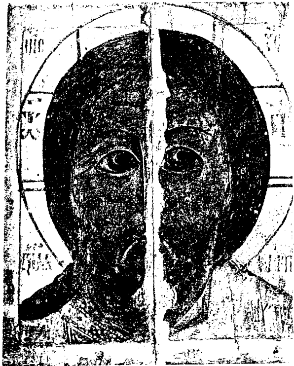
3. Полная расчистка иконы до восстановления утраченныхъ мѣстъ.