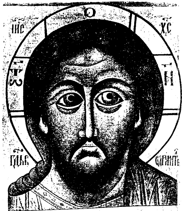
4. Икона Спасителя по реставраціи.