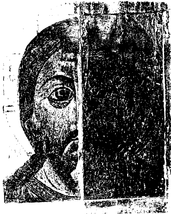
2. Частичная расчистка иконы.