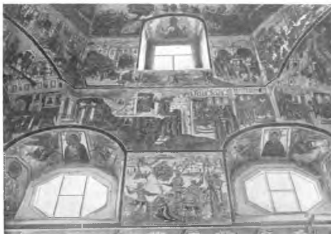
Вологда. Фреска 1710 г. в ц. Покрова на Козлене.