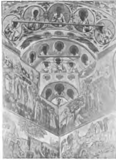
Вологда. Роспись парусов 1717 г. в Иоанно-Предтеченской Гощенской церкви.