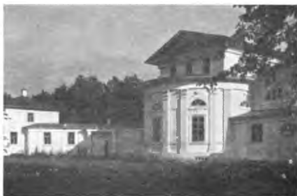
Фасад дома в „Псковском“ со двора.