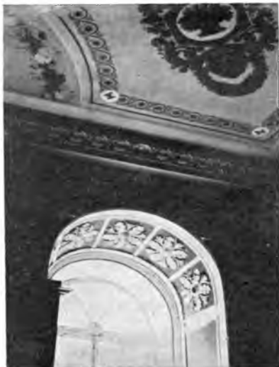
Обработка комнаты в „Покровском“.