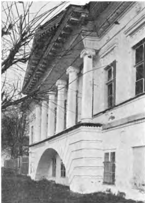
Вологда. Скулябинская богадельня.