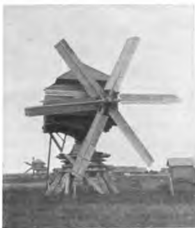
Мельница под Вологдой.