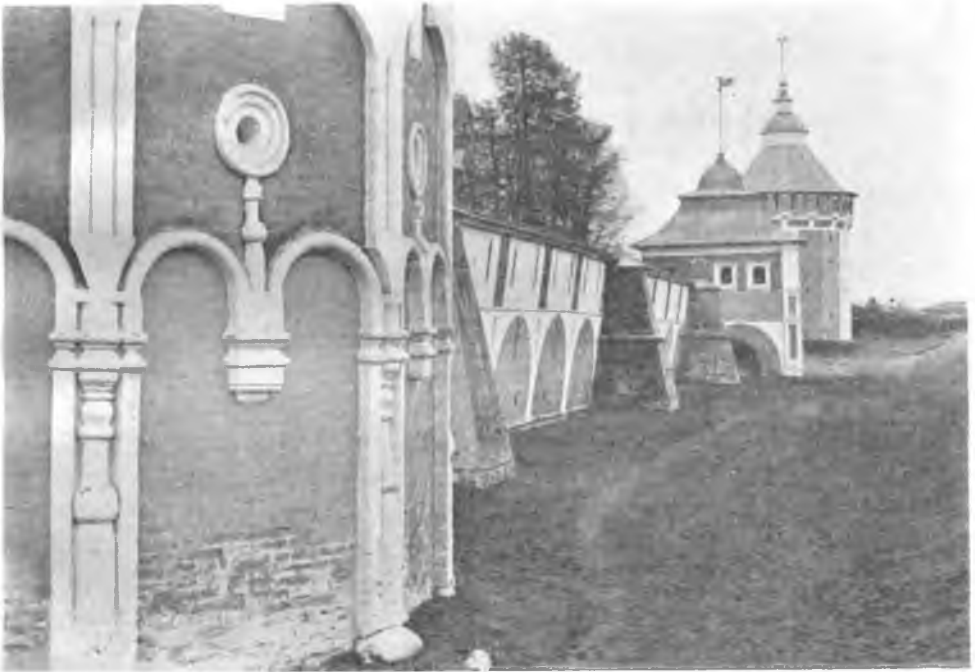
Башни и стены Прилуцкого монастыря около г. Вологды.