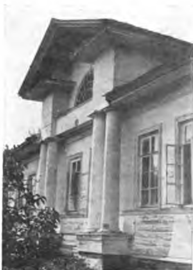
Вологда. Барский особнячок на Бестужевской улице.