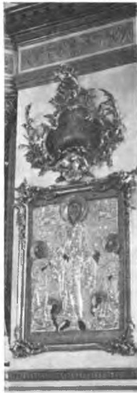
Вологда, Барочные украшения стен в ц. Николы во Владычной слободе.