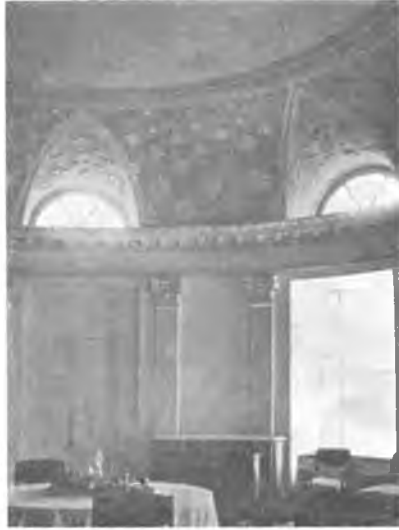
Внутренний вид комнаты в „Покровском“.