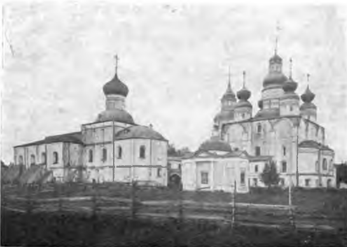
Собор Прилуцкого монастыря. Переходы. Кельи.