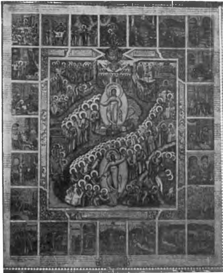
Вологда. Икона Воскресения Христова XVIII в. в Иоанно-Богословской церкви.