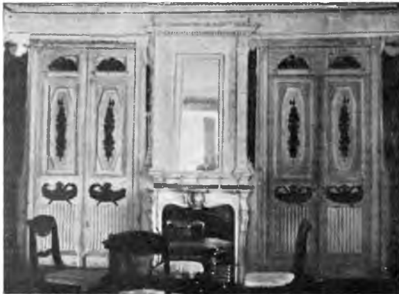
Внутренний вид комнаты в „Покровском“.