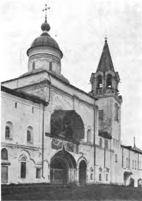
Надвратная церковь в Прилуцком монастыре.