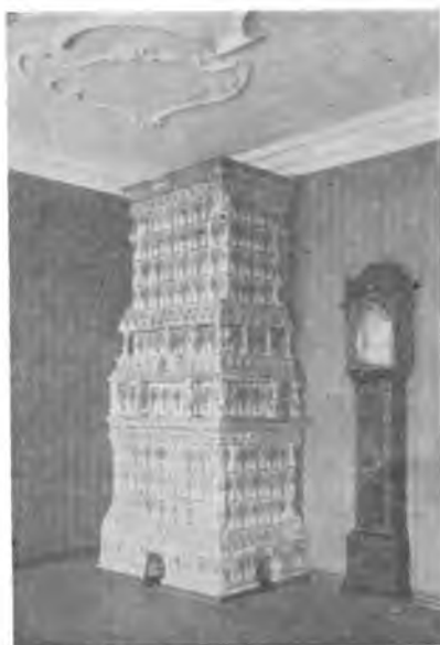
Вологда. Изразцовая печь XVIII ст. и часы начала XIX ст. в Архиерейском доме.