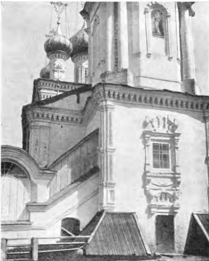
Вологда. Сретенская церковь.