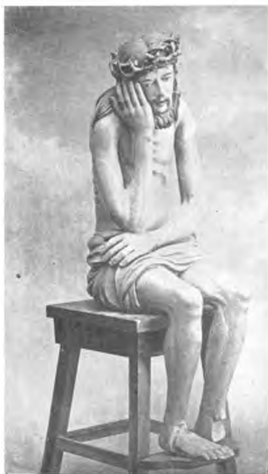
Вологда. Деревянная статуя „Христос в темнице“ в музее общества изучения северного края.