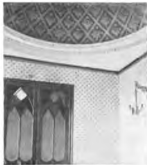
Обработка комнаты в „Юрово“.