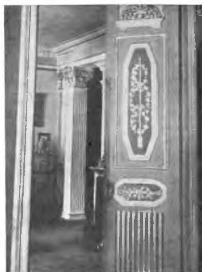
Обработка комнаты в „Покровском“.