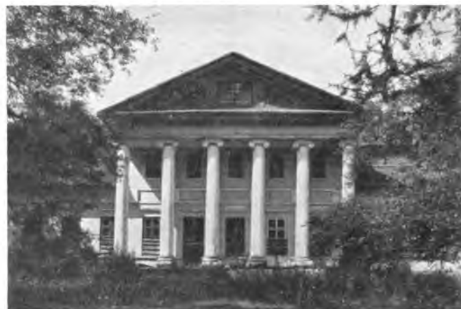
Барский дом в „Погорелове“ Вологодского уезда.