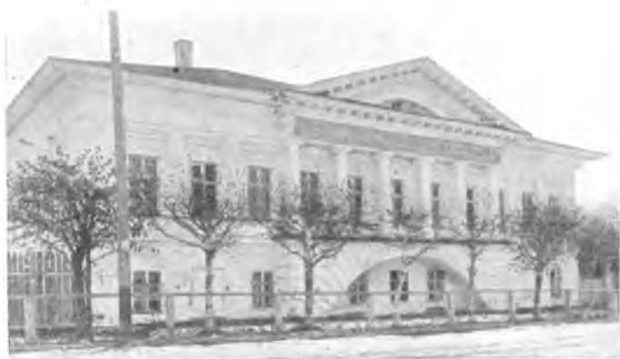
Вологда. Скулябинская богадельня.