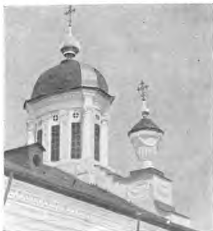
Вологда. Варлаамо-Хутынская церковь XVIII в.