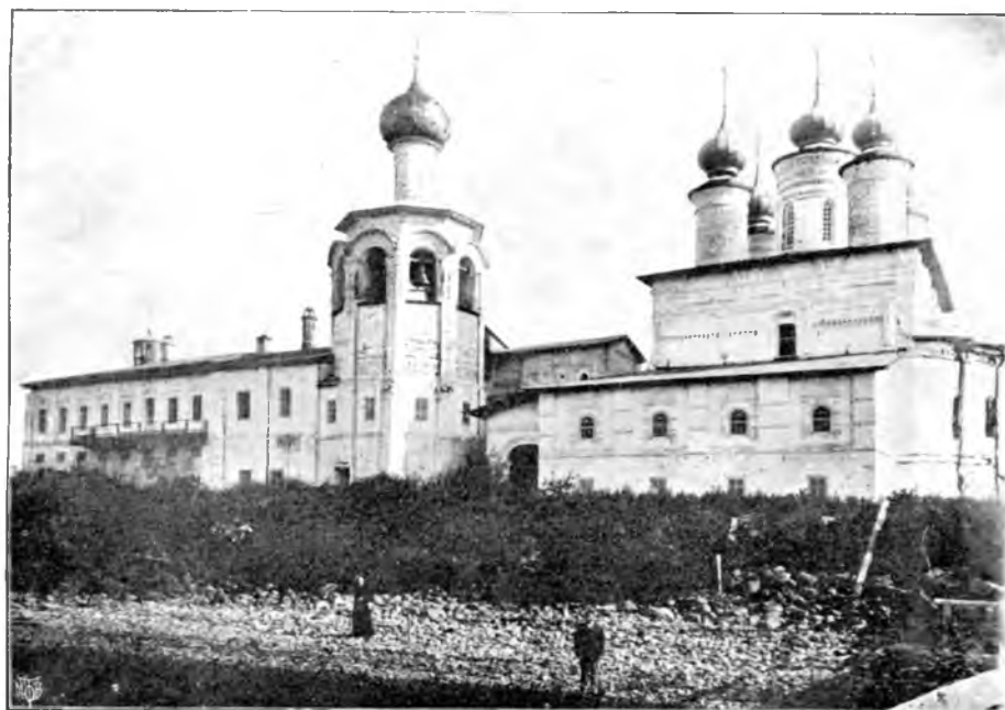
Каменный монастырь на Кубенском озере.