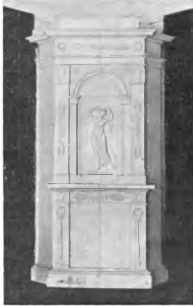
Вологда. Изразцовая печь на Петербургской улице.