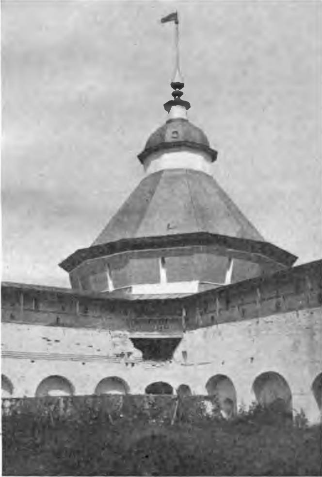
Прилуцкий монастырь около г. Вологды.