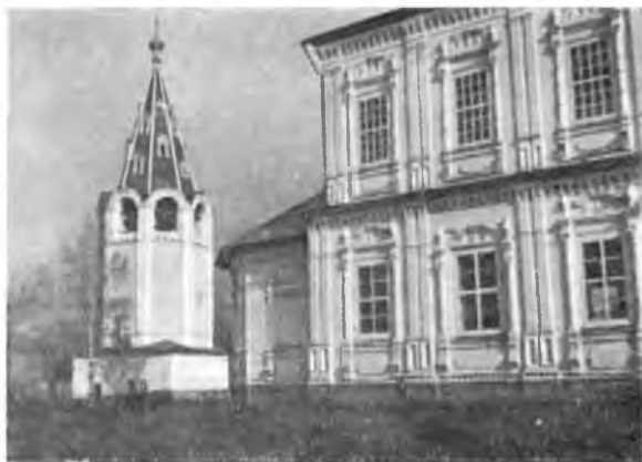
Вологда. Владимирская церковь.