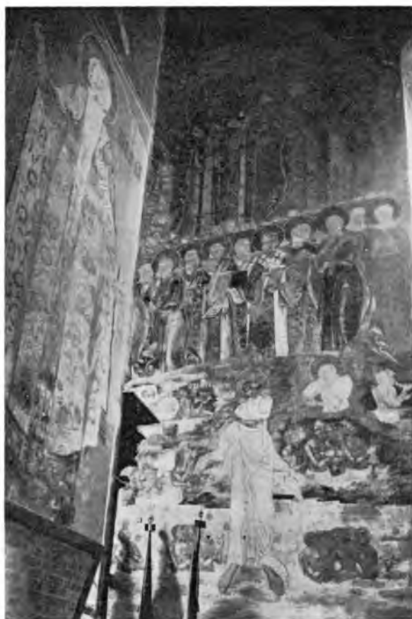
Вологда. Фреска „Страшный суд“ 1686—1688 г. в Софийском соборе.