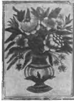
Вологда. Печной изразец.