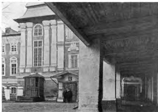
Вологда. Части архиерейского дома.