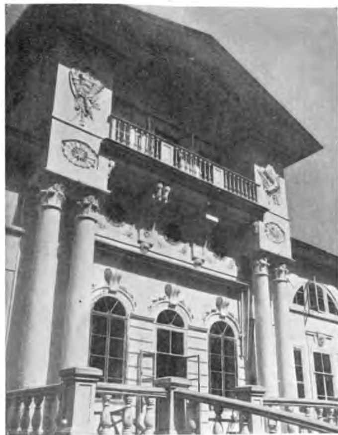
Вологда. Деталь барского дома в „Покровском“ постройки начала XIX века.