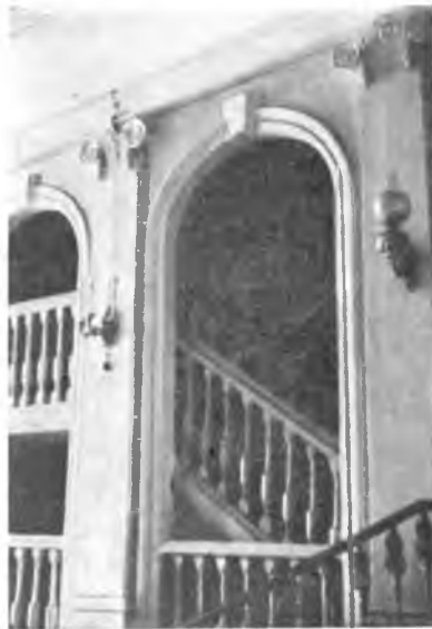
Вологда. Лестница на хоры в Дворянском собрании.