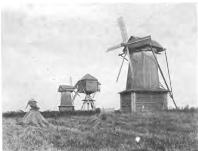
Мельницы под Вологдой.