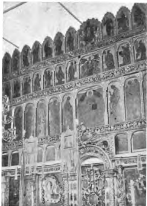
Волгода. Иконостас в Цареконстантиновской церкви.