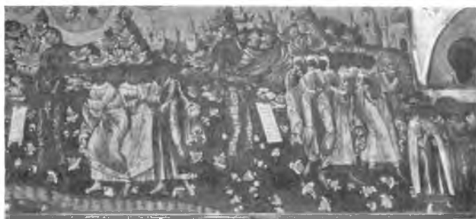
Вологда. Фреска 1717 г. в Иоанно-Предтеченской Рощенской церкви.