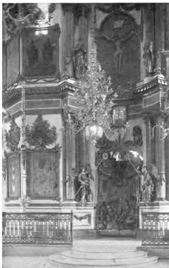
Волгда. Иконостас церкви Николы во Владычной слободе.