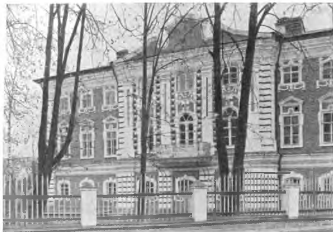
Вологда Архиерейский дом 1764—1769 г.г.