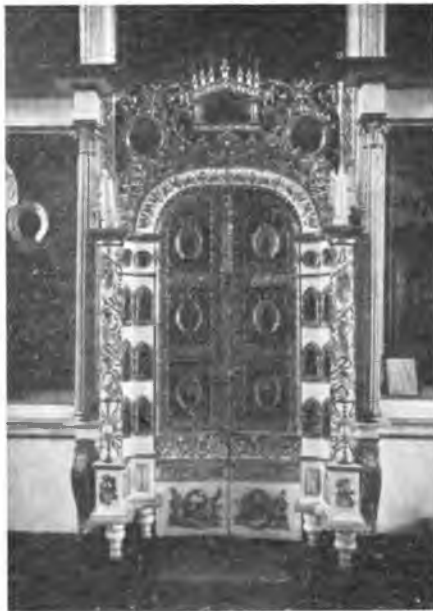
Вологда. Деревянные резные царские врата в ц. Вознесенья.