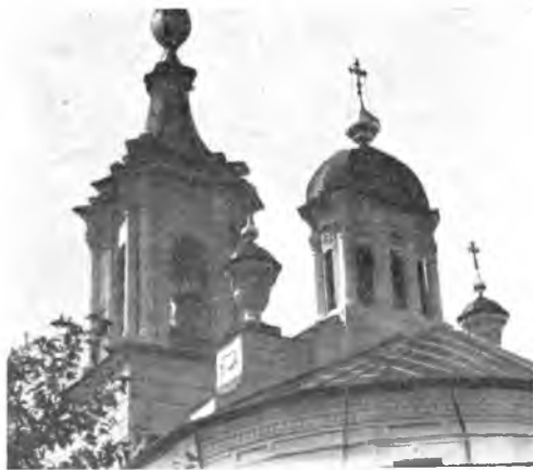
Вологда. Варлаамо-Хутынская церковь XVIII в.