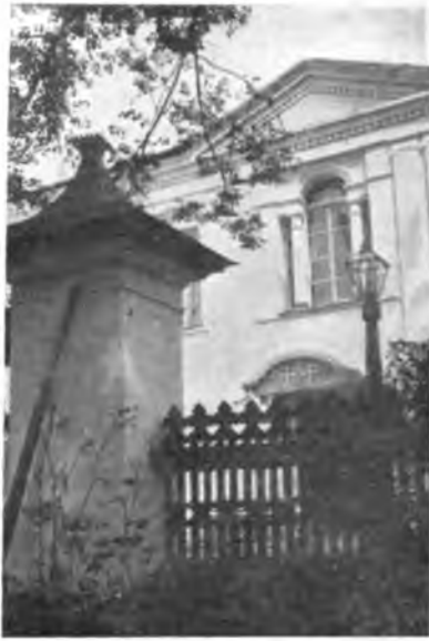
Кельи в Прилуцком монастыре.