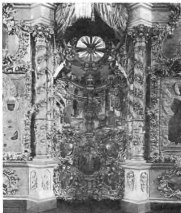
Волгода. Деталь иконостаса в церкви Дмитрия Прилуцкого, что на Навслоке.