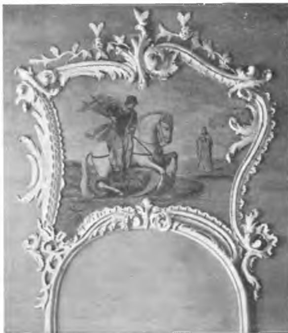
Вологда, Барочные украшения стен в ц. Николы во Владычной слободе.