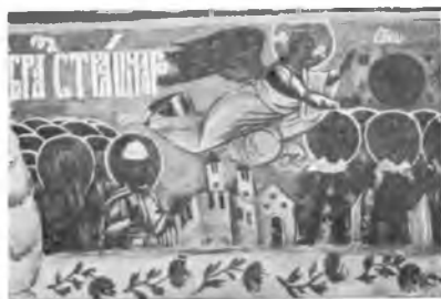
Вологда. Фреска 1710 г. в ц. Покрова на Козлене.