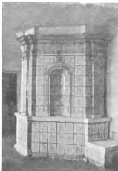
Вологда. Изразцовая печь в Скулябинской богадельне.