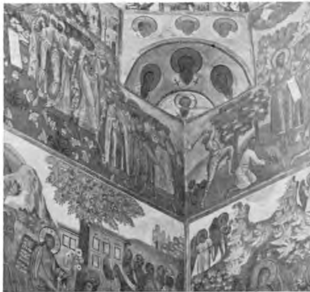
Вологда. Роспись стен 1717 г. в Иоанно-Предтеченской церкви, что в Рощенье.