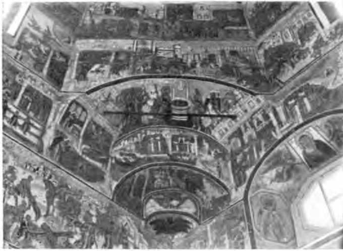
Вологда. Роспись стен 1710 г. в Покровской церкви, что на Козлене.