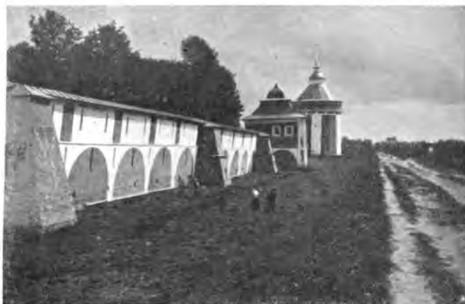
Стены Прилуцкого монастыря.