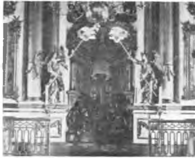
Вологда. Иконостас в церкви Николы во Владычной слободе (1669).