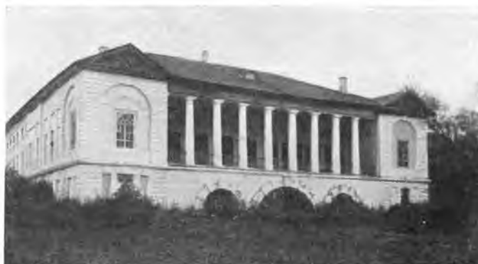
Барский дом в „Юрове“ Грязовецкого уезда.