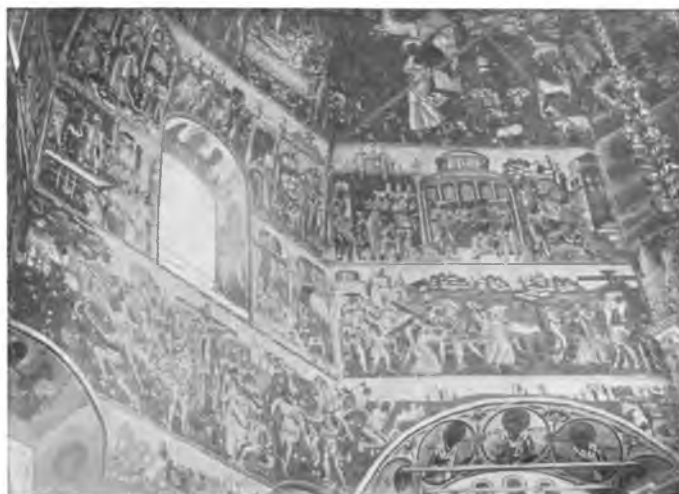
Вологда. Роспись северной стены 1717 г. Иоанно-Предтеченской церкви, что в Рошенье.