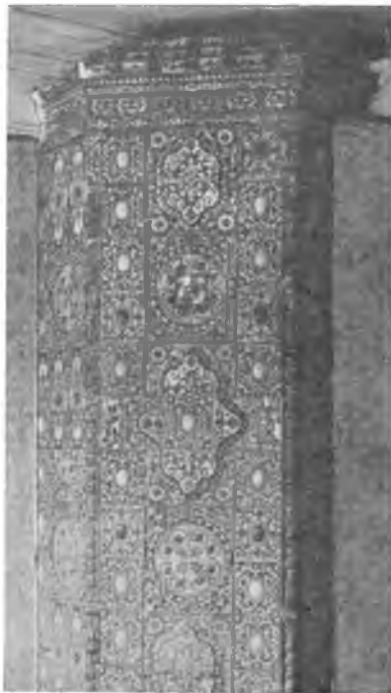
Вологда. Изразцовая печь в бывшей Дворянской богадельне.