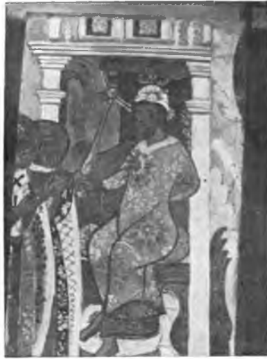
Вологда. Фреска 1710 г. в Покровской церкви, что в Козлене.