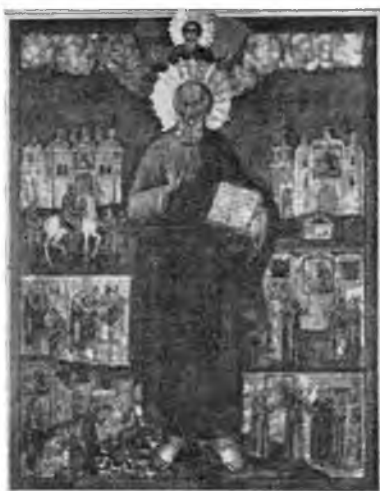
Вологда. Икона Иоанна Богослова в Иоанно-Богословской церкви.