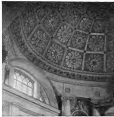
Купол церкви в „Покровском“.