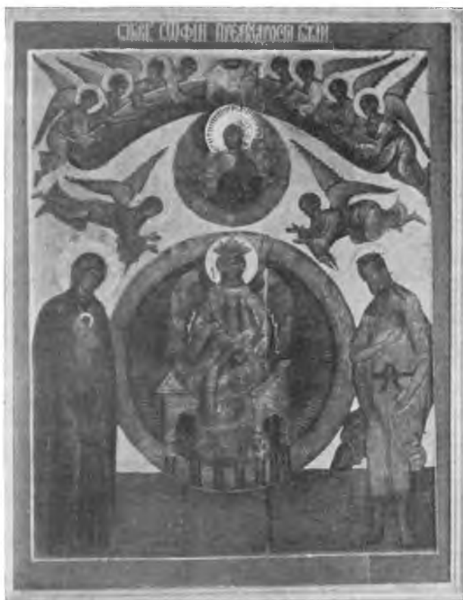
Вологда. Икона св. Софии в Георгиевской церкви.