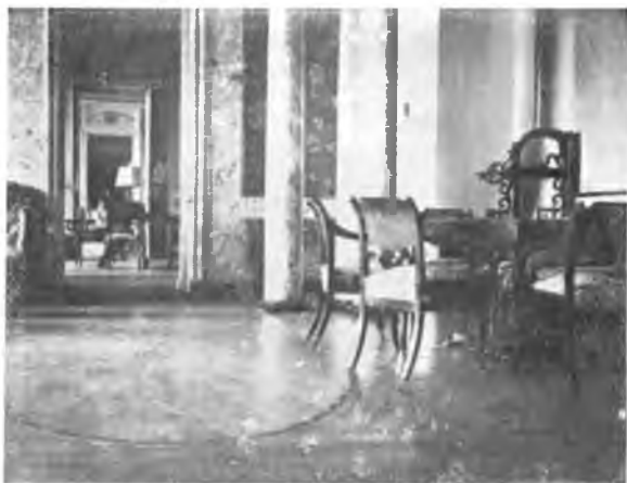
Колонная комната в „Никольском“.