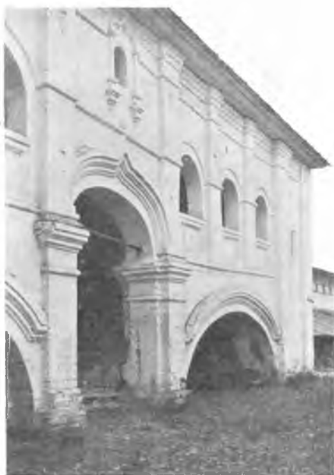
Галереи при кладовых в Прилуцком монастыре.