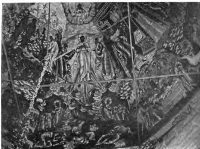
Вологда. Роспись купола 1717 года Иоанно-Предтеченской церкви, что в Рошенье.