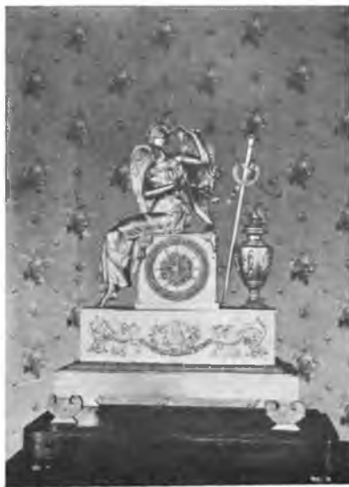
Часы начала XIX ст. в „Кобылино“ под Вологдой.