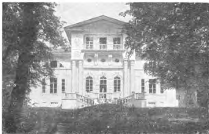
Барский дом в „Покровском“.