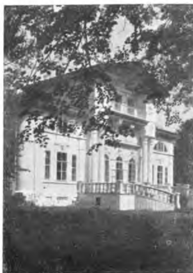
Барский дом в „Покровском“.