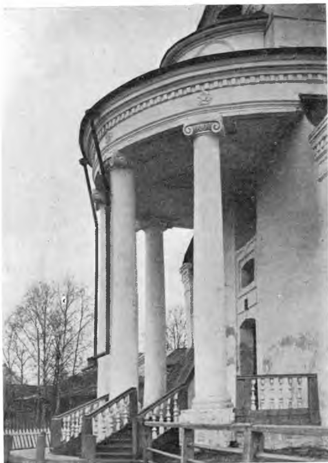
Вологда. Входная ротонда Варлаамо-Хутынской церкви, что в Каменье. XVIII в.