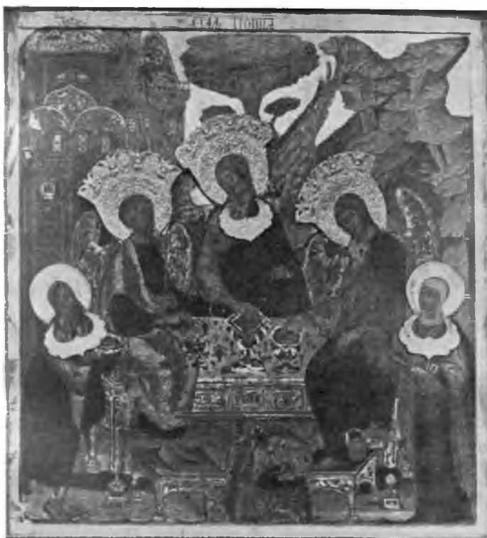
Вологда. Икона „Святая Троица“ XVI в. в Цареконстантиновской церкви.