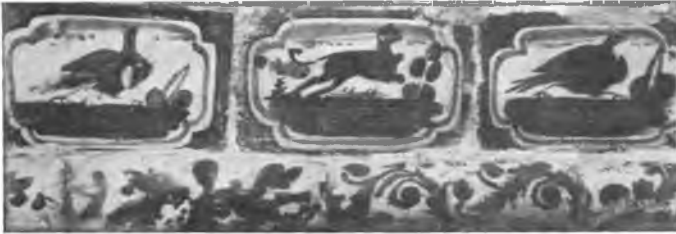
Вологда. Печные изразцы в Архиерейском доме.