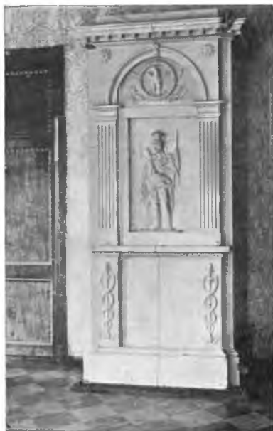
Вологда. Изразцовая печь на Петербургской улице.