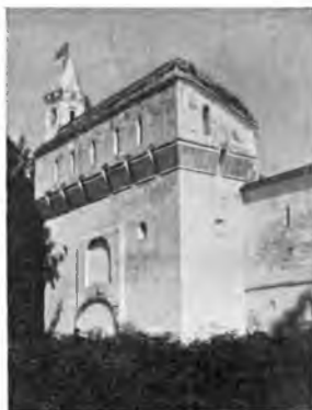
Вологда. Угловая башня Кремля. (1671—1675).