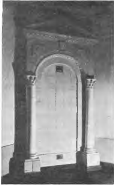
Вологда. Изразцовая печь на Петербургской улице.