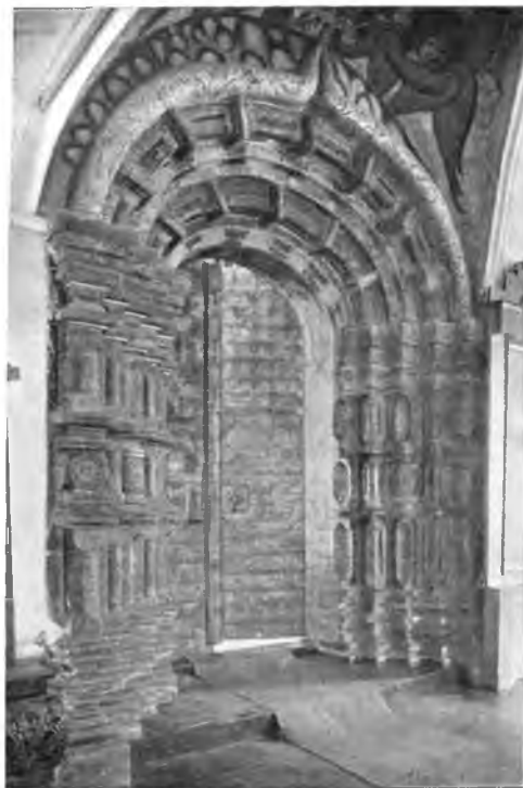
Волгда. Входная арка XVII в. Цареконстантиновской церкви.