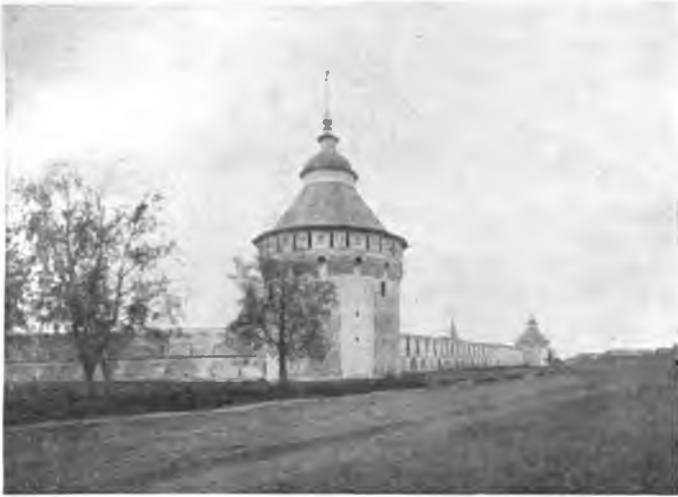
Угловая башня Прилуцкого монастыря.