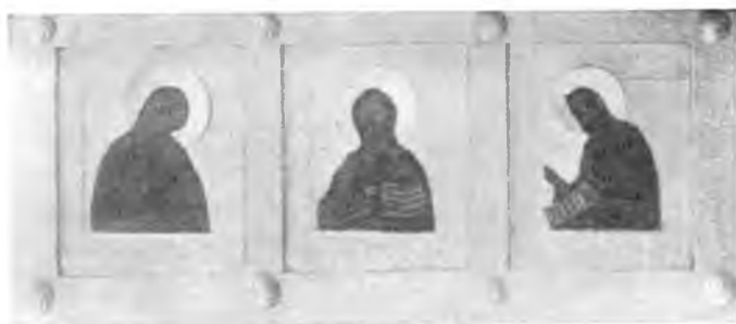
Вологда. Деисус XV в. в Иоанно-Предтеченской церкви, что в Дюдиковой пустыни.