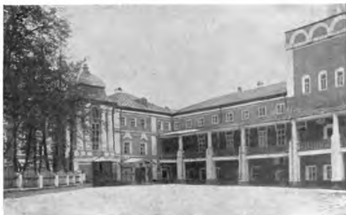
Вологда. Внутренний вид Кремля.