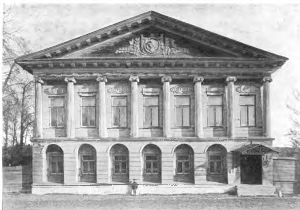
Вологда. Барский дом на Екатерининско-Дворянской улице постройки 1829 года.