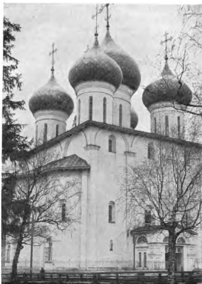
Вологда. Софийский собор XVI в.