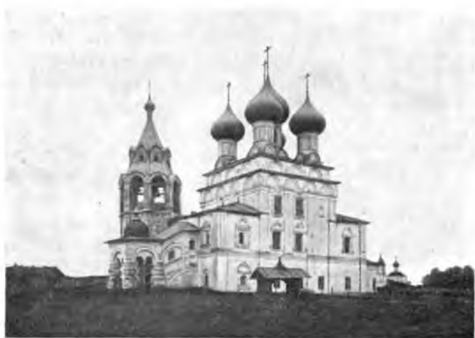
Вологда. Цареконстантиновская церковь XVII в.