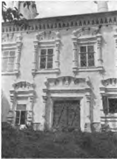
Вологда. Барочная обработка Сретенской церкви.