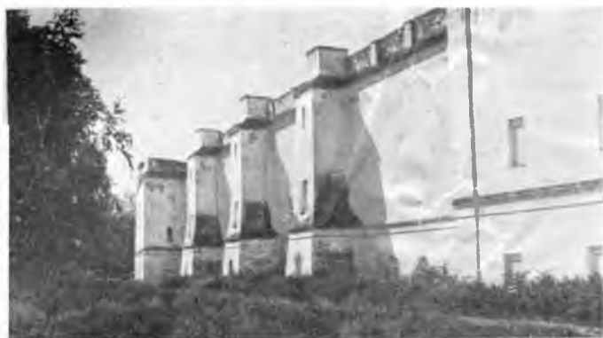
Вологда. Соборная стена с контрафорсами.