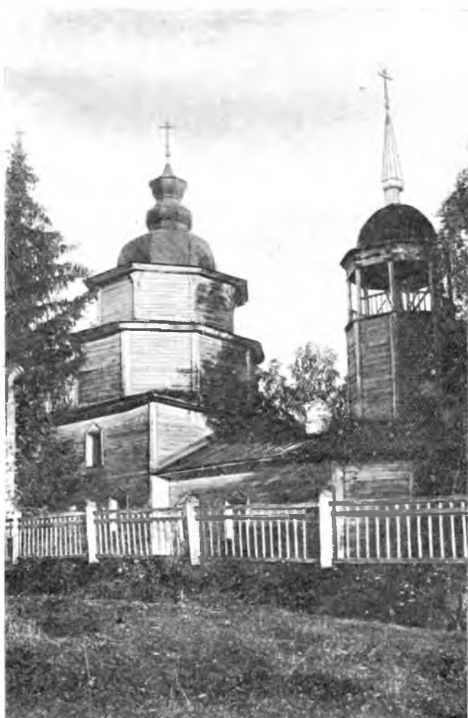
Деревянная церковь XVIII в. в Грязовецком уезде Вологодской губ.