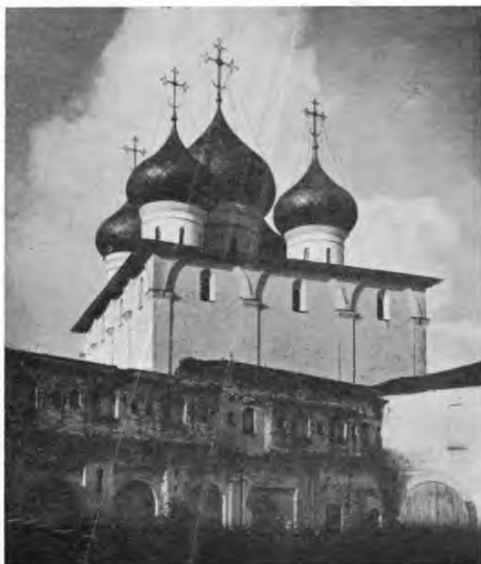
Вологда. Софийский Кафедральный собор XVI в.