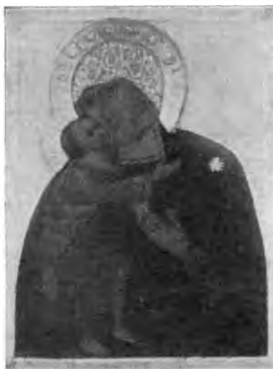
Вологда. Икона Владимирской Божьей Матери XVI в. в Иоанно-Предтеченской церкви, что в Дюдиковой пустыни.