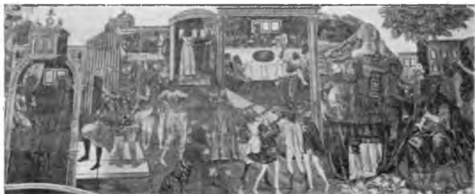
Вологда. Фреска 1717 г. в Иоанно-Предтеченской церкви, что в Рощенье.