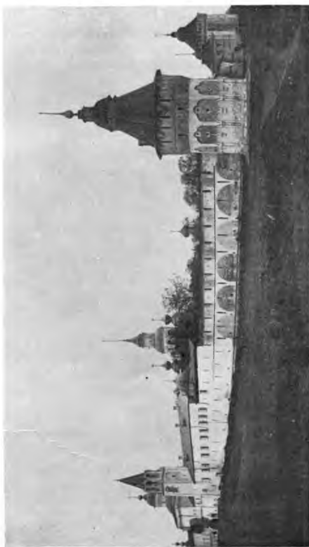
Стены Прилуцкого монастыря.