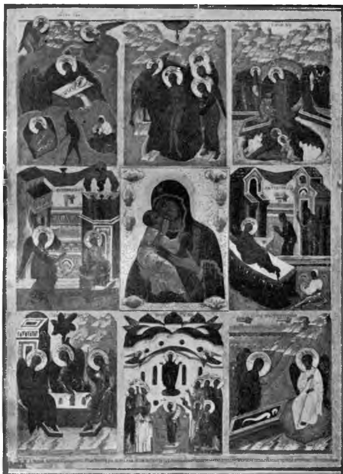
Вологда. Икона Владимирской Божией Матери 1549 г. во Владимирской церкви.