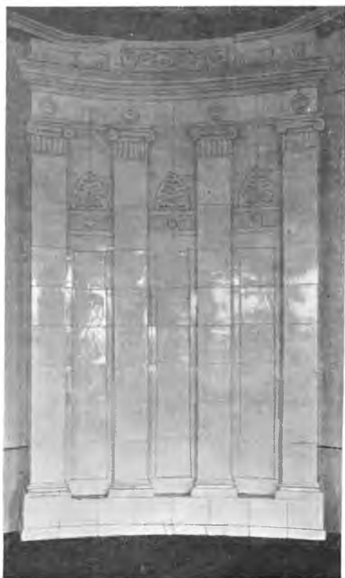
Вологда. Изразцовая печь на Петербургской улице.