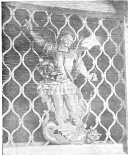
Тотьма. Деревянный Георгий Победоносец в Георгиевской церкви.